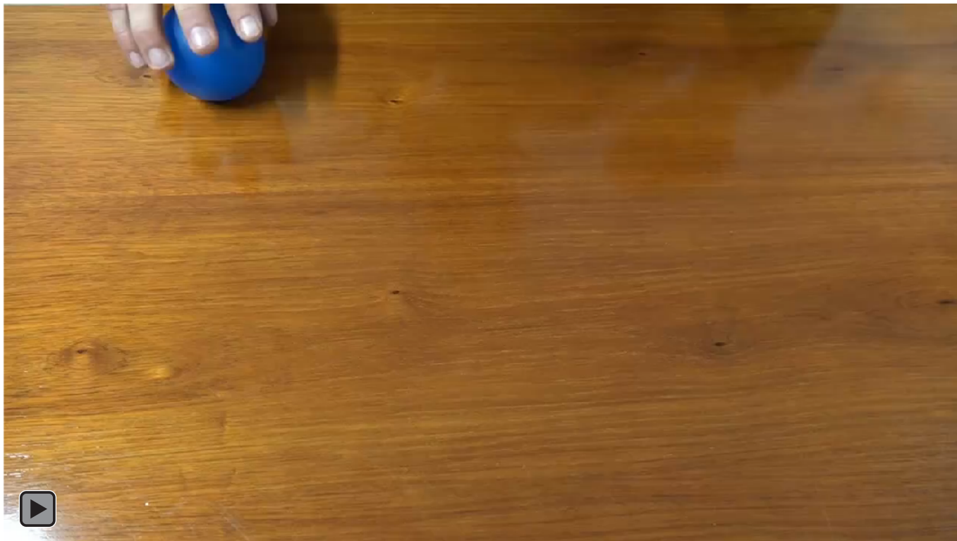
Figura 2. Juego motor con patrón de malabares de deslizamiento de una bola sobre la mesa con la mano hábil (figura DEM1)

Deslizamiento de una bola sobre la mesa con la mano hábil, ver figura 2 o DEM1.