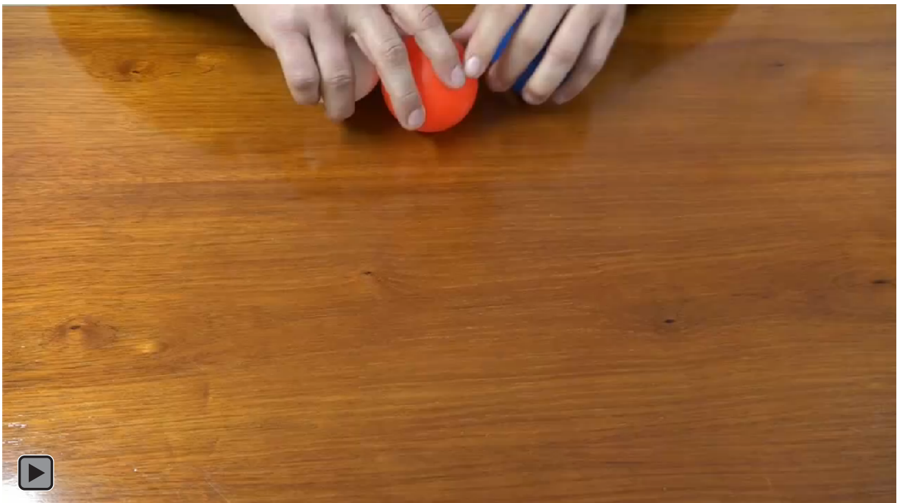
Figura 1. Juego motor con patrón de malabares deslizando tres bolas encima de la mesa (figura DEM5)

La figura 1 o figura DEM5 es el objetivo final, conseguir realizar malabares con tres bolas deslizando encima de la mesa.