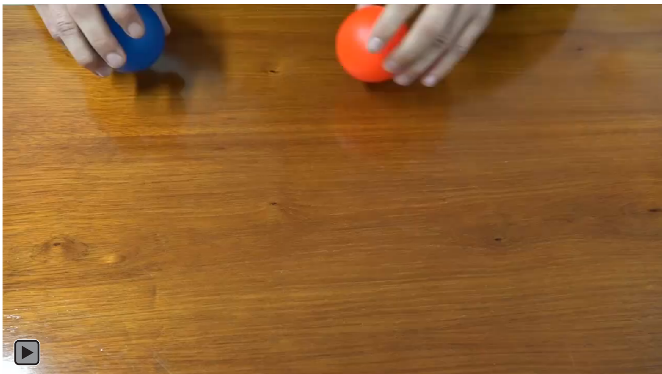
Figura 5. Juego motor con patrón de malabares con deslizamiento de dos bolas sobre la mesa con la mano hábil y mano no hábil pasando de una a otra, (figura DEM4)

Deslizamiento de dos bolas sobre la mesa con la mano hábil y mano no hábil pasando de una a otra, ver figura 5 o DEM4.