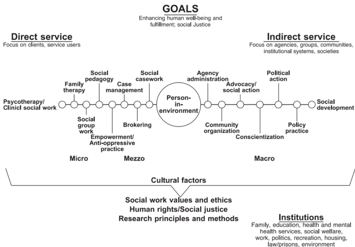
Ilustración 1. Niveles y elementos que definen el Trabajo Social

Esta definición hace especial referencia al compromiso del Trabajo Social con los DDHH y la justicia social como el camino correcto para la intervención profesional (Hare, 2004; Healy, 2008; Lima, 2016). Sobre esta base, Hare (2004, p. 412) elabora una propuesta que recoge los principales ejes que definen el Trabajo Social a partir de tres niveles de intervención profesional: micro, meso y macro (ilustración 1). Como reconoce la misma autora, son visibles importantes variaciones en la práctica del Trabajo Social, por lo que el elemento determinante y aglutinador para definir la práctica de esta profesión es atender a la persona en interacción con su entorno físico y social. Reconociendo este hecho, la práctica profesional puede desarrollarse tanto en el ámbito público como en el privado.