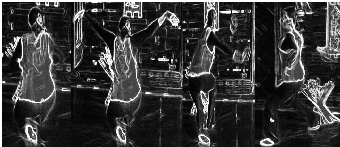
Figura 5. Fotograma: primer boceto de una partitura de movimiento, instalación árbol de navidad, acto I, escena 1 (inicio de la obra).

momento concebida de forma figurativa) y a esa convención espacial escénica, donde además el performer se relaciona con otro, siempre con el propósito de generar un diálogo corporal encaminado hacia la acción dramática.