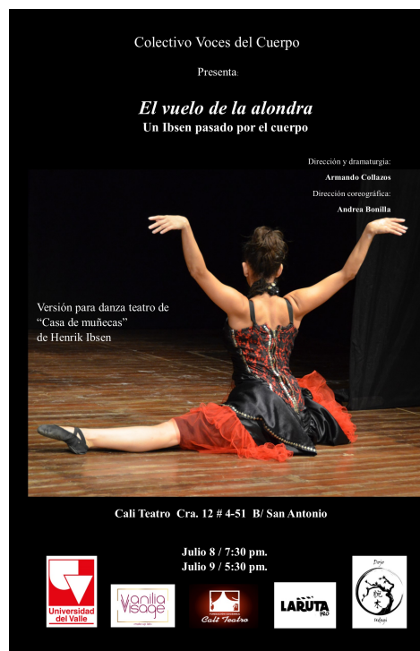
Figura 1. Cartel promocional del estreno de El vuelo de la alondra .

Si en Casa de Muñecas la relación de sus personajes está sustentada fundamentalmente en lo textual, en la adaptación a teatro físico, titulada El vuelo de la alondra (Figura 1), se ha procurado sustituir dicha textualidad, usando la danza y el arte del cuerpo como instrumentos para comunicar esa intención discursiva.