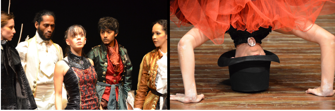
Figura 6. Vestuario clásico con toque bondage y vintage.