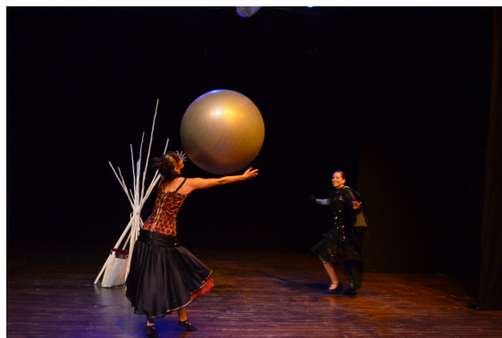
Figura 4. Ejemplo de imagen metafórica: la pelota como metáfora de juego infantil, una manera de representar los hijos de los Helmer (protagonistas de la obra).

El trabajo con el maestro Agudelo basado en la combinación de lo poético de Marceau y la capacidad de abstracción de Decroux, fusión enriquecedora para el proceso de creación, facilitó el camino a lo esencial del texto de Ibsen y al encuentro de un tipo de movimiento que lo significara, destacando especialmente la construcción de imágenes metafóricas (Figura 4), fundamental para no reiterar ni ilustrar el texto en el momento de la interpretación. Ejemplo de ello: en Casa de muñecas existen como personajes los niños, hijos del matrimonio entre Helmer y Nora; en El vuelo de la alondra se resuelve su presencia física remplazándolos por una gran pelota. El significado de este objeto unido a la acción física generada a través del juego con ella permitió resolver su presencia de forma metafórica.