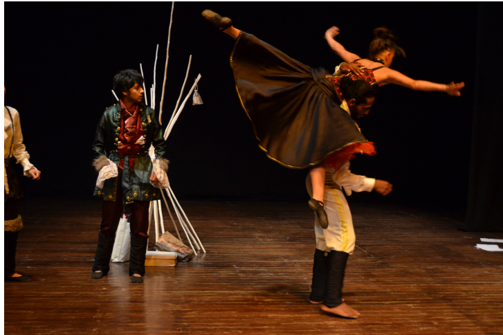
Figura 3. Ejemplo de impulso corporal, basado en las ideas de Grotowsky, extrapolado a lo corporal y en correspondencia a la gramática resultante.

ininterrumpida sucesión. Lo anterior es apoyado por la noción de impulso (Figura 3) como elemento clave desde una perspectiva psicológica tal como lo propone Grotowski, extrapolándolo luego a lo corporal, donde los deseos y motivaciones internas inducen a actuar de forma espontánea: “las verdaderas acciones físicas siempre están ligadas a deseos o anhelos”, palabras de Grotowski recogidas en Richards (2005).