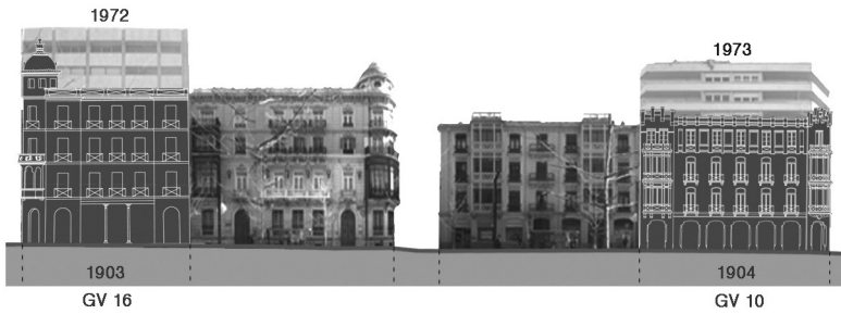
Restitución de las fachadas originales de los edificios Gran Vía 28, 26, 24 y 22, superpuestas sobre los alzados de los edificios contemporáneos