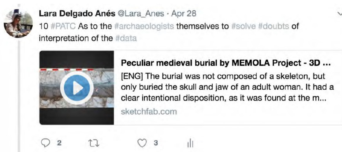
Fig. 3 Tweet 10 #PATC «Peculiar medieval burial»

We tried to obtain feedback from the conference and Twitter users in relation to one of our 3D models. Our objective was to obtain information on a case of medieval Islamic burial located at the archaeological site Pago del Jaraffi , and to find out through the use of «the crowd» if there was any similar cases in another site anywhere else in the world. In this case, unfortunately we didn't get answer about our specific question (v. fig. 3).