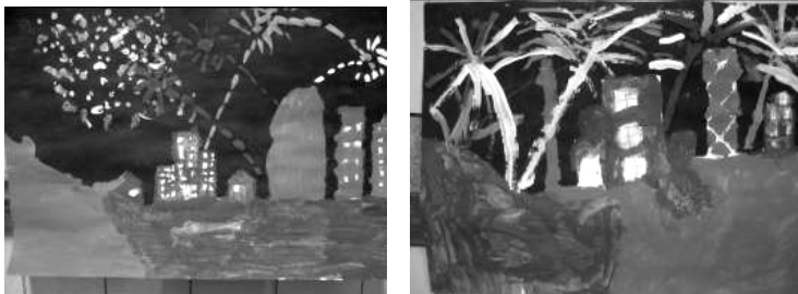
Barcelona + Mercè + noche = castillos de fuegos y música