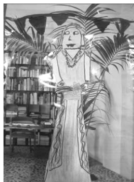
Técnica mixta: collage y dibujo al natural de los gigantes

Como cantaba Joan Manuel Serrat, “nacimos en el Mediterráneo”; el conocimiento en medio social se dirige precisamente a esta circunstancia. Conocer la cultura mediterránea, los países que la integran, donde se sitúan, las características