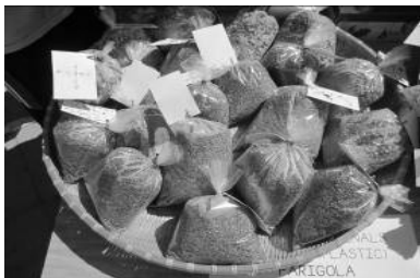
Bolsas de hierbas medicinales