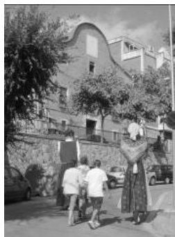
Rua de gegants i cabezudos