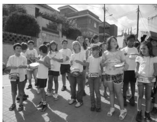
Timbals y timbalers

- Realizamos bailes y danzas, dando protagonismo especialmente a la sardana.