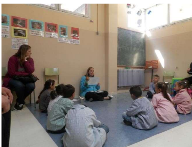
Tertulia literaria en P5 en la Escuela Mediterrani

la música y el arte. Las tertulias se llevan a cabo en las aulas con los estudiantes y también en formación de familiares en la escuela. Los participantes eligen las obras clásicas que desean leer y la cantidad de páginas que se leerán en cada sesión. Cada persona en su casa elige un párrafo de esas páginas para compartir con las demás personas. Al día siguiente, cada persona lee el párrafo en voz alta a los demás y explica por qué lo ha elegido. Después, se abre turno de palabra y se hacen aportaciones, así, el proceso continúa hasta que se acaban los párrafos.