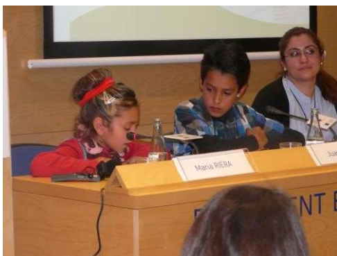
Presentación en la conferencia final de un proyecto europeo ROM UP! The inclusion of Roma through quality successful educational experiences. 35768-LLP-1-2011-1-ES-KA1-KA1NWR a cargo de dos estudiantes de primaria, hermanos, que explicaron la importancia de la participación de su madre en su colegio.

Proyectos europeos como EDUROM (European Commission, 2013-2015) y ROM UP (European Commission, 2012-2013), de los cuales ha sido socio el departamento de Bienestar Social y Familia, están contribuyendo a difundir por toda Europa los resultados de la implementación de la formación de familiares. La formación de familiares ha sido una de las actuaciones implementada por el Plan integral porque impacta directamente en el rendimiento académico de sus hijos e hijas. La desarrollaremos con más detalle, más adelante.