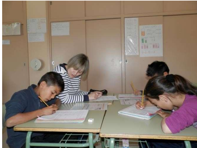
Grupo interactivo en la Escuela Mediterrani. Tarragona

Los grupos interactivos se pueden implementar en cualquier nivel formativo y en cualquier materia. En formación de familiares también se pone en práctica esta forma de organización del aula: