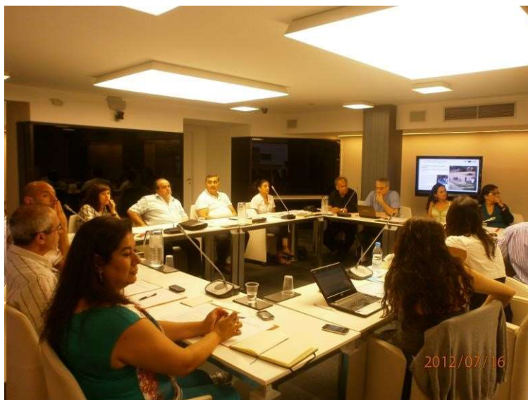
Reunión del Consejo Asesor del CEG en el que se aprobó el código ético del investigador/a

conocimiento ni de sus objetivos ni de lo que ocurría posteriormente con los resultados obtenidos.