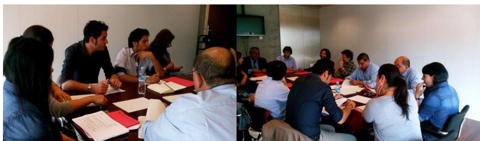
Equipo de renovación del Plan integral del pueblo gitano

El equipo trabajó a partir de diferentes fuentes de información: 1) las aportaciones de los distintos grupos de trabajo del Plan, 2) las principales investigaciones sobre pueblo gitano que habían demostrado impacto social, 3) las recomendaciones europeas y la estrategia nacional gitana. Se realizó un trabajo de síntesis por ámbitos de trabajo que fue analizada en diferentes sesiones de trabajo, en la sede del departamento de Bienestar Social y Familia. La diversidad de los miembros del equipo aportó calidad al trabajo y permitió recoger aportaciones muy importantes. Se procuró que todas las acciones estuvieran alineadas con las investigaciones y con las recomendaciones políticas internacionales. Una vez definidas todas las medidas, se realizó una selección de prioridades y se calendarizaron para los próximos dos años.