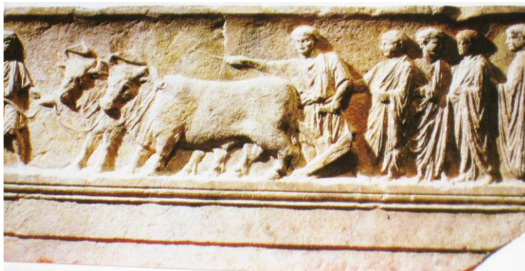
753 BC by Romulus and Remus.