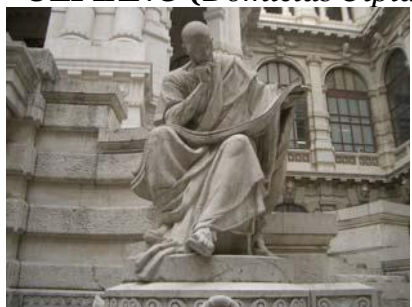
El jurista Ulpianus . Foto fachada del Tribunal Supremo italiano. Roma

IV.-ETAPA POST-CLÁSICA (IMPERIO ABSOLUTO). Entre el año 280 d. C., desde Diocleciano (periodo conocido como Dominado ) hasta la caída de Roma en poder de los de los Hérulos , en el año 476 d. C. a manos de Odovakar , nombrándose rey de Roma.