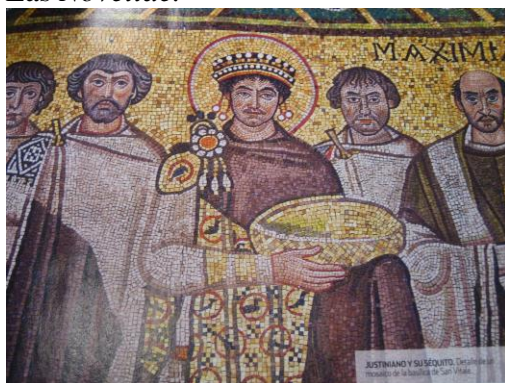
Justiniano y su séquito. Detalle del mosaico de la basílica de san Vital.

En el año 1538 un monje llamado Gothofredus cambió el nombre de esta obra llamándola Corpus Iuris Civilis , en contraposición con el Corpus Iuris Canonici , o cuerpo legal de leyes de la Iglesia.