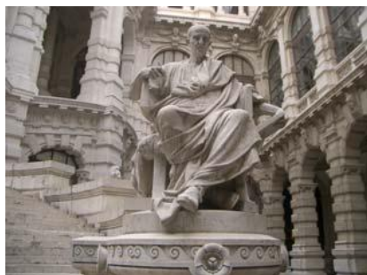
Jurista Labeo . Tribunal Supremo italiano. Roma