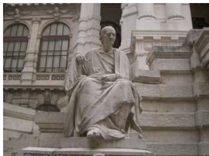
Jurista Paulus . Tribunal Supremo italiano. Roma