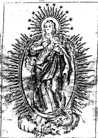
REFUGIUM PECCATORUM MONSTRATE ESSE MATREM.