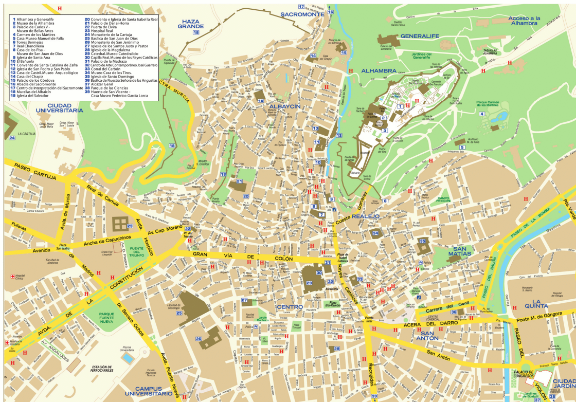
Figura 2. Mapa de Granada

Fuente: http://www.granada-in.com/pdf_guia/pdf/mapa_granada.html . (Consultado: 22/04/2015)