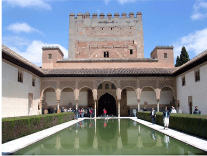
Figura 8. Palacio de Comares