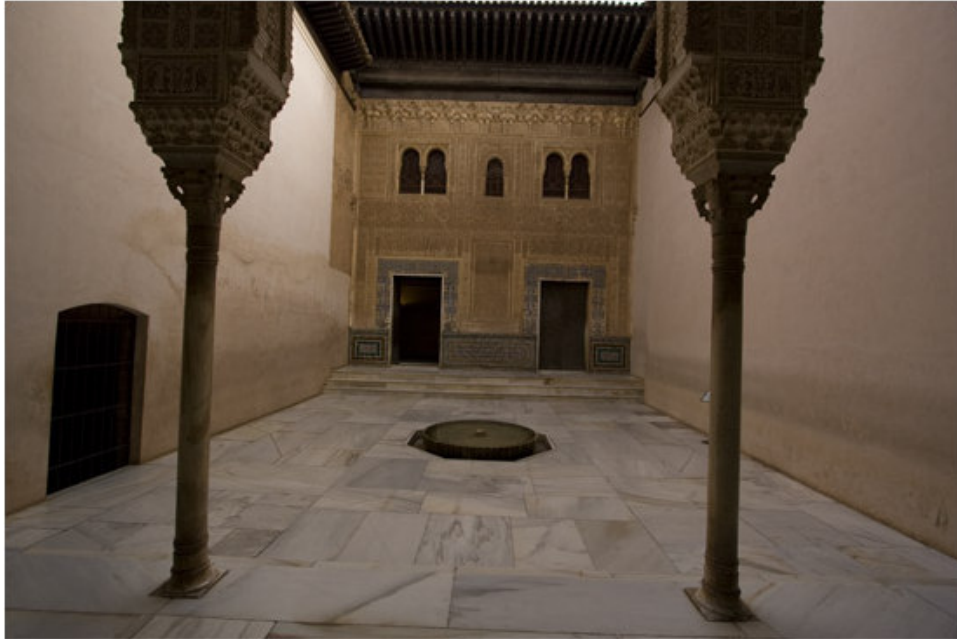
Figura 15. Fachada de Comares