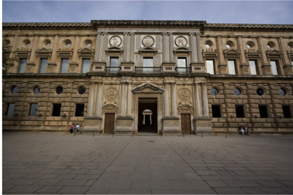
Figura 14. Palacio de Carlos V

Observad las fotografías y decid el lugar del que puede tratarse.