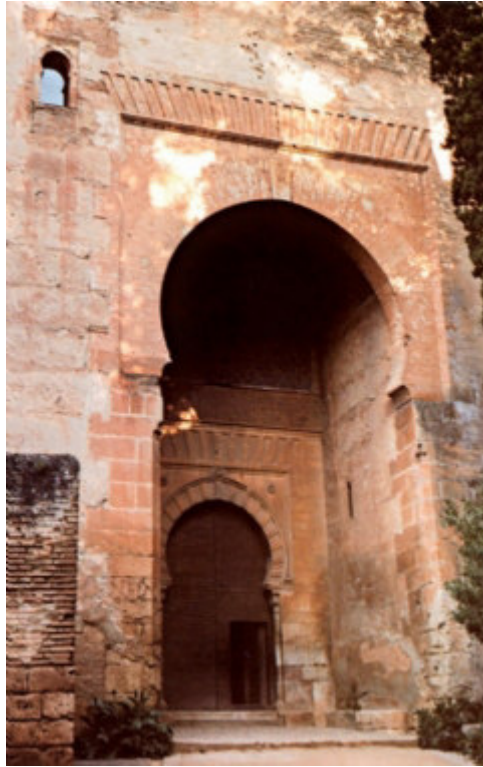
Figura 5. Puerta de la Justicia. Alhambra de Granada