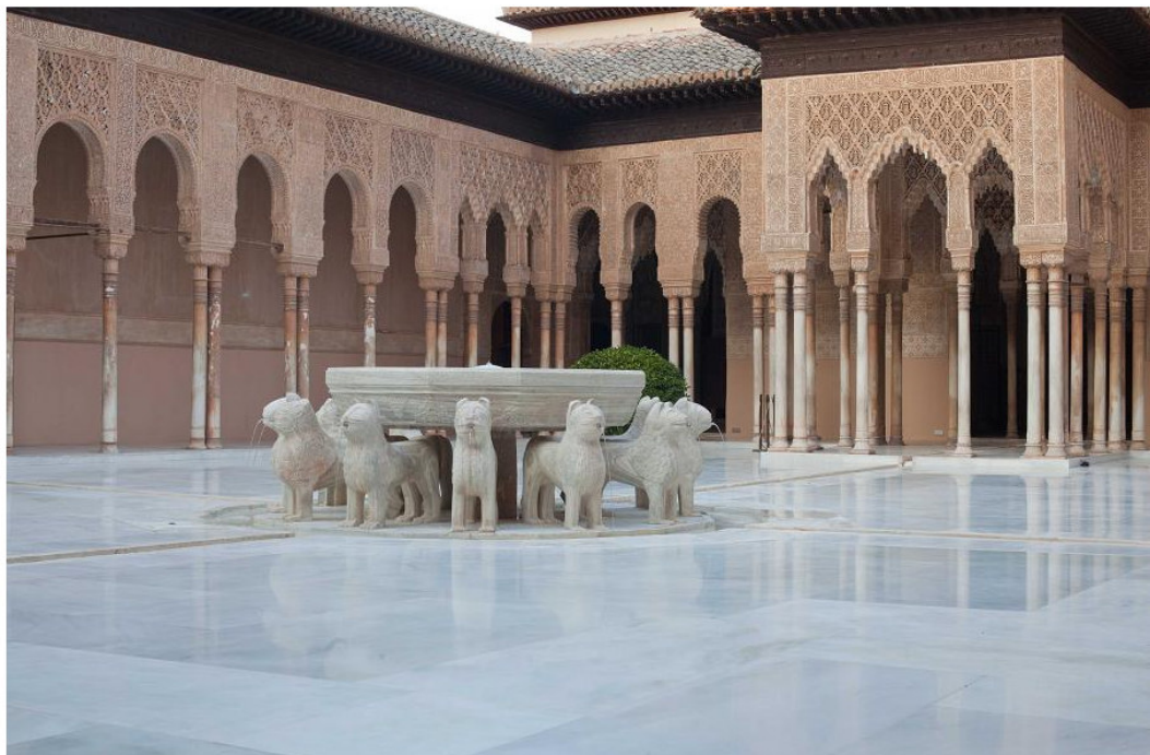
Figura 19. Palacio de los leones