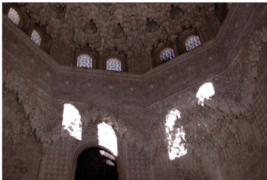
Figura 21. Sala Dos hermanas