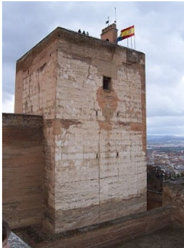
Figura 23. Torre de la Vela