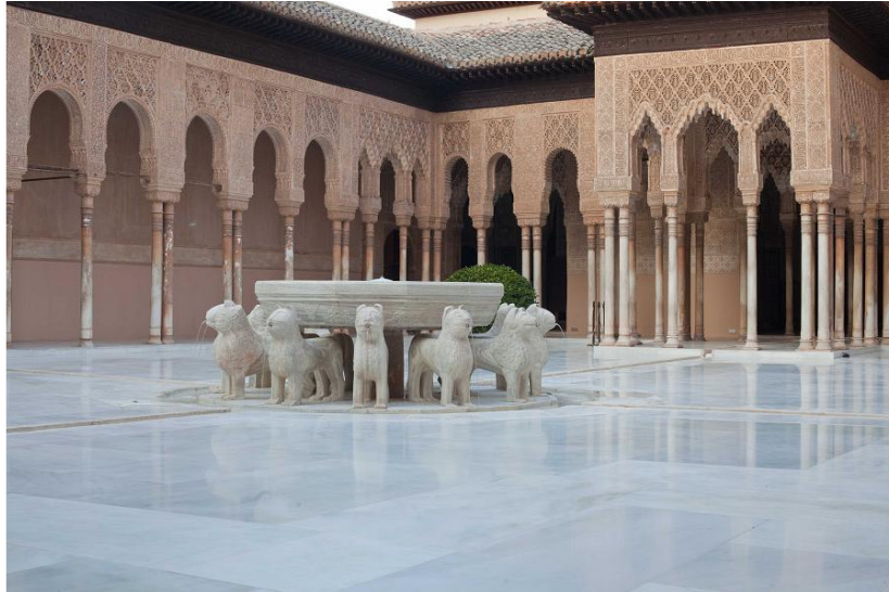
Figura 6. Palacio de los leones