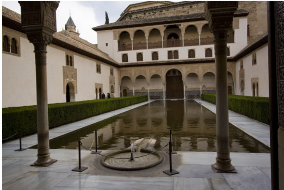
Figura 20. Patio Arrayanes