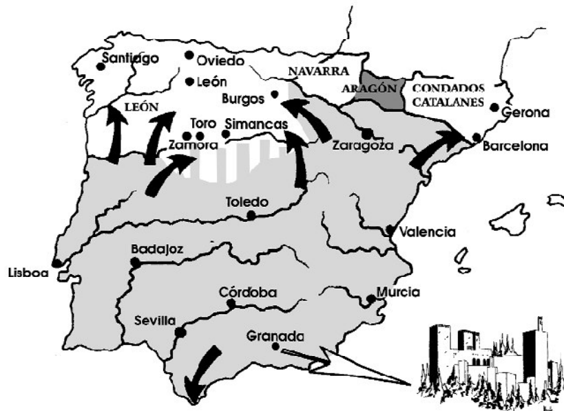
Figura 3. Mapa de expansión de Al-Ándalus