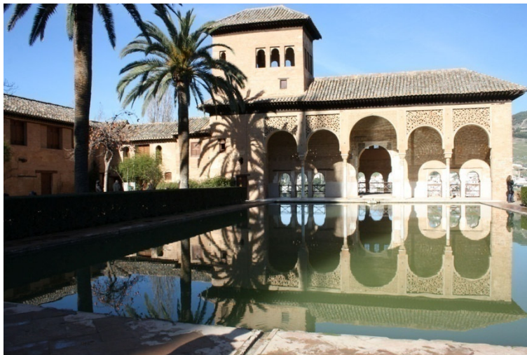
Figura 7. Palacio del Partal