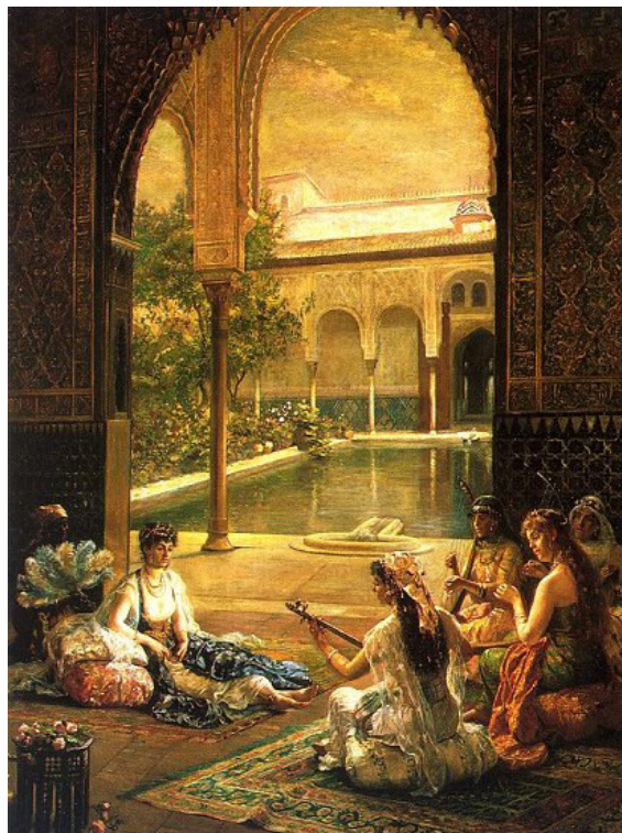
Figura 13. Imagen de la vida en la Alhambra

Con música árabe de fondo vais a observar este cuadro. Según los sentimientos que os transmitan escribiréis una historia, es totalmente libre.