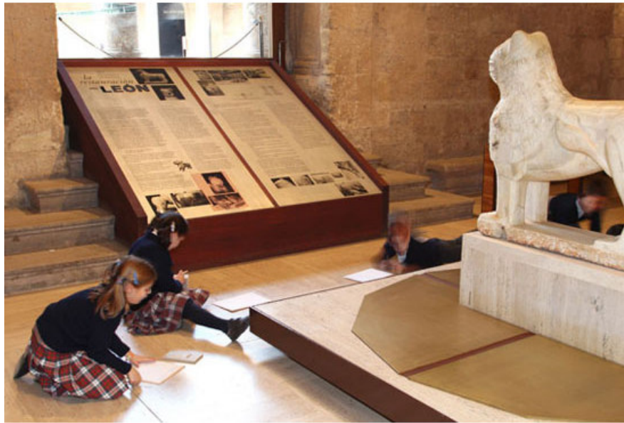
Figura 18. Museo de la Alhambra