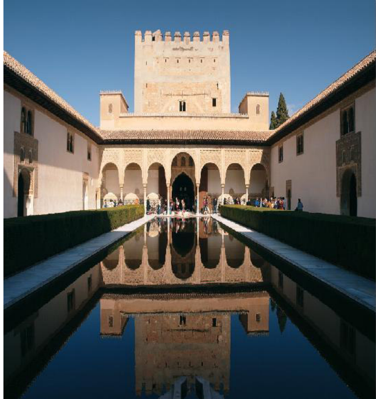
Figura 17. Palacio de Comares