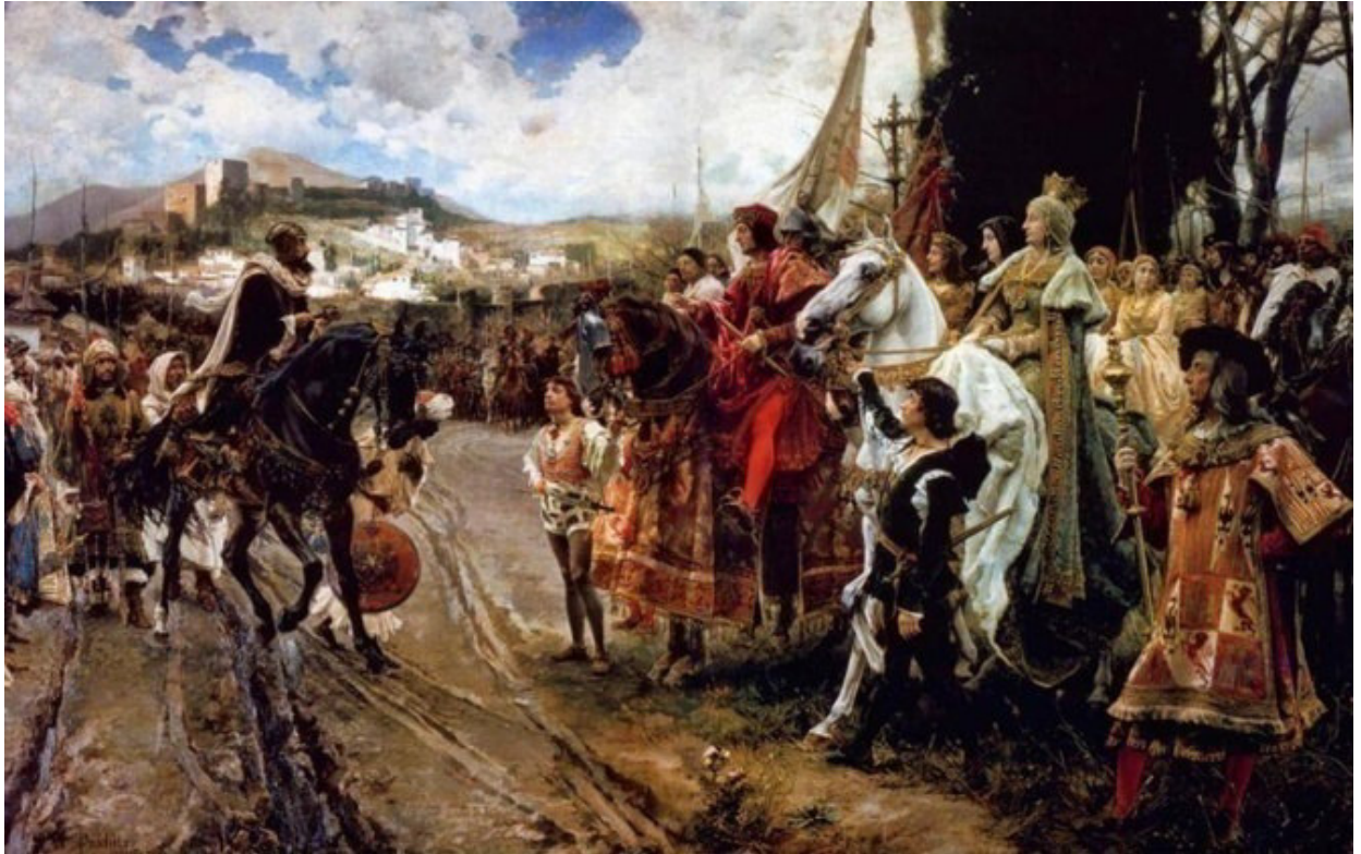
Figura 9. La reconquista de Granada