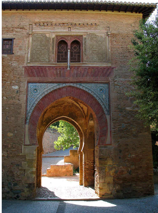
Figura 4. Puerta del Vino. Alhambra de Granada