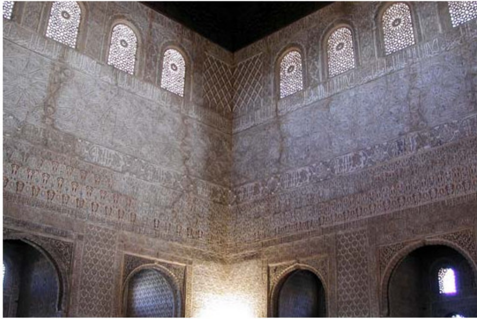
Figura 22. Salón Embajadores