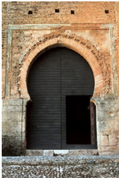
Figura 3. Puerta de las Armas. Alhambra de Granada

Describir las semejanzas y diferencias de las siguientes fotografías.