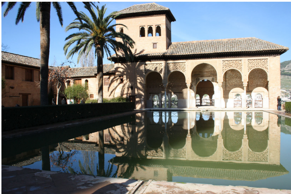
Figura 16. Palacio del Partal