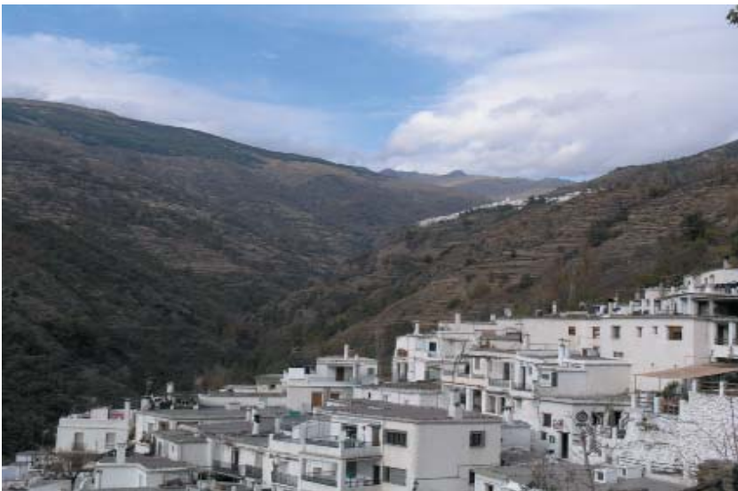
Imagen 12: Barranco de Poqueira (Alpujarra Granadina), donde se puede apreciar la relación entre los núcleos urbanos y su contexto agrario. Elaboración propia.