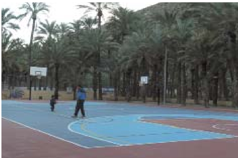
Imagen 5: Palmeral de San Antón (Orihuela, Alicante). Elaboración propia.

como por ejemplo en la declaración de BIC de inmuebles como conventos, palacios o ciudades históricas o en los catálogos de los planes urbanísticos y territoriales, el cambio más importante vendría de la necesaria e ineludible consideración de la condición agraria en cualquier acción de tutela (delimitación, restauración, ordenación, musealización, gestión, etc.) que se realice sobre un bien agrario. Intervenciones como la realizada en el Palmeral de San Antón de Orihuela, declarado BIC, (Canales, 2013) donde todo el espacio destinado a huerta, con la excepción de las lindes donde están plantadas las palmeras, ha sido destinado a las infraestructuras docentes y lúdicas del municipio, constituye para nosotros un desdichado símbolo de la inadecuada intervención sobre los bienes agrarios, al ocultar y enmascarar (como sucede en este caso, en el que las palmeras son tratadas a modo de bosque ajenas a su condición de parte de un sistema de cultivo) la esencia de los mismos, su función agraria [Imagen 5]. Lo mismo se podría decir de los innumerables ejemplos de cortijos, palomares, chozos, eras, zahúrdas, cuadras, secaderos, etc., objeto de rehabilitación en los cuales rara vez se piensa en el uso agrario como opción y donde los espacios y elementos más propiamente agrícolas o ganaderos quedan relegados o alterados a no ser que dispongan de una materialidad relevante desde el punto de visto artístico.