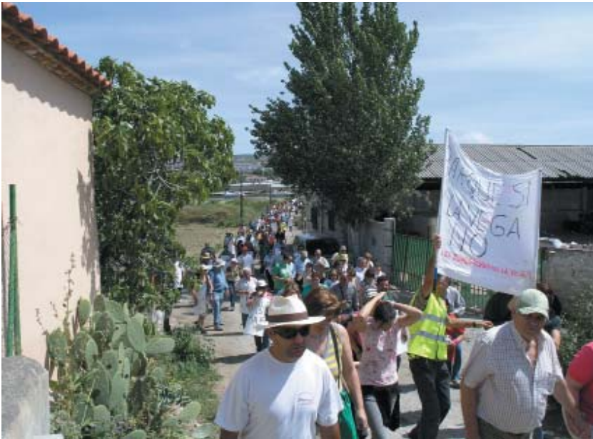
Imagen 9: Marcha organizada por la Plataforma Salvemos la Vega contra la instalación del Parque del Milenio en la Vega Sur (10-05-2009).Elaboración propia.

Con la identificación y singularización de estos valores, lo que hacemos en la Carta de Baeza es asumir como principales valores aquellos que en las últimas décadas han sido definidos y reclamados desde el ámbito medioambiental (aunque también social y político) a través de este amplio movimiento de la Agricultura Ecológica y de la Agroecología en