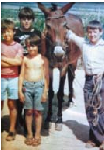
Imagen 19: Nuestro pasado agrario está aún muy cercano en todos nosotros... Cortijo Iznadiel (Torreblascopedro, Jaén), 1979. Elaboración propia.

confluencia o entendimiento. Si además, como sucede en este caso, lo que pretendíamos era otorgarle valores y significados a la propia actividad agraria, dese luego necesitábamos de forma imprescindible la confluencia, hablar el mismo lenguaje. Y ese único lenguaje es el del manejo real de la tierra o el ganado. Sólo acreditando ante los ojos de los agricultores o ganaderos el sacrificio, la actitud, el sudor, el sentido del tiempo y de la realidad, la forma de mirar al cielo o la austeridad que requiere el trabajo en el campo podíamos adquirir la legitimidad (y permiso) para poder acceder a sus saberes (sobre todo en su condición de legado atesorado consuetudinariamente) y, a partir de aquí, proceder a elaborar otros conceptos, otras palabras que ellos pudieran incorporar a su lenguaje y, sobre todo, que pudieran defender y transmitir ante sus iguales... Y compruebo muy gratificado entonces que el concepto de Patrimonio Agrario que estamos cultivando puede tener legitimidad, que puede ser entendido por todos, por todos aquellos que quieran utilizar el lenguaje del entendimiento, el de la tierra».