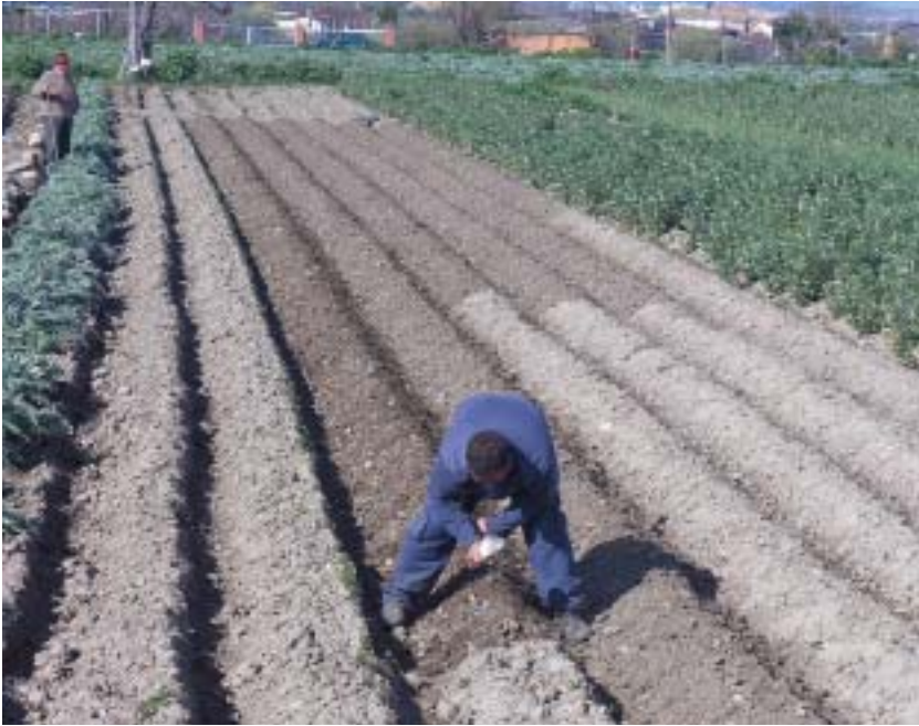
Imagen 18: Un agricultor escardando patatas en la Vega de Granada (Cájar, Granada).

Por lo que se refiere a la dimensión productiva que estamos analizando, debemos señalar, más bien subrayar, que la Tutela del Patrimonio Histórico ya tiene plenamente incorporada la dimensión funcional entre sus principios y mecanismos de actuación. Esto es especialmente constatable en los conjuntos históricos, donde el mantenimiento de la diversidad funcional urbana (vivienda, servicios públicos, tiendas, hoteles...) es una exigencia ineludible en cualquier política de protección desde la instauración del concepto de conservación integrada en la Carta de Patrimonio Arquitectónico de 1975 (Salmerón, 2004). La calificación de usos a través de los instrumentos urbanísticos, al margen de todas las acciones, medidas y políticas de fomento de la rehabilitación y usos de los centros históricos, es el instrumento principal utilizado para ordenar las funciones de estos espacios urbanos históricos y su respetuosa adecuación a los valores culturales de los mismos. Esto significa que el procedimiento instaurado consiste en remitir al ámbito (normativo y administrativo) correspondiente, en este caso el urbanístico, la responsabilidad y competencia para regular y preservar la dimensión funcional de estos espacios; procedimiento éste que sería perfectamente aplicable a cualquier otro espacio, como