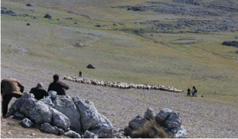
Imagen 15: Pastores con una manada de ovejas de raza lojeña (Loja, Granada).

Igual complejidad y controversia supone incluir en el concepto de Patrimonio Cultural bienes propios de la naturaleza como las semillas, las variedades locales, las razas autóctonas, los suelos, los acuíferos, etc. [Imagen 15]. De nuevo aquí la modernidad, el avance que implica el Patrimonio Agrario respecto al actual concepto de Patrimonio Cultural es mucho, ya que profundiza y progresa en una de las aspiraciones principales de este concepto a lo largo de la historia tal y como antes hemos explicado: conseguir la interrelación, la fusión, entre cultura y naturaleza. Hasta ahora esa interrelación se circunscribía o al territorio (y desde una perspectiva muy orográfica) donde se situaba los diferentes bienes culturales, especialmente inmuebles, o a los elementos vegetales o arbóreos utilizados en las composiciones estéticas de los jardines históricos. Con el concepto de Patrimonio Agrario los bienes naturales entran con fuerza en el Patrimonio Cultural y no sólo en una mayor amplitud y diversidad, que ya es en sí muy importante (todos los recursos naturales utilizados y aprovechados para la actividad agraria), sino, y esto es el salto de dimensión, en su condición de elemento vivo a través, por ejemplo, del patrimonio genético, imprescindible para la preservación de razas autóctonas y variedades locales, las cuales también son objeto de protección. Como ya hemos expuesto en