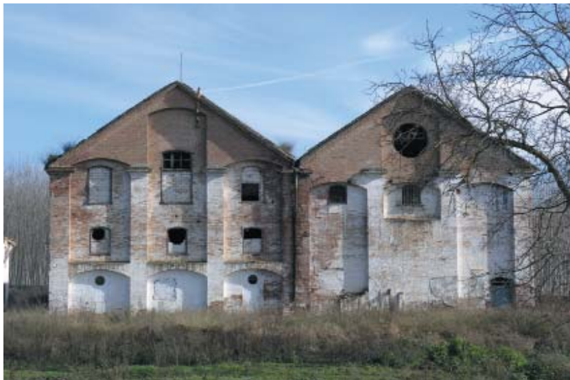
Imagen 14: “El Polvorín”. Fábrica de azúcar y alcoholes Nuestro Señor de la Salud (Santa Fe, Granada). Elaboración propia.

Si nos centramos en los principios que sustentan el actual modelo de tutela del Patrimonio Cultural, también encontramos presupuestos que favorecen el reconocimiento del Patrimonio Agrario. Destacamos dos: