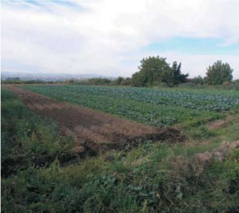
Imagen 2: Cultivos en la Vega de Granada (Cájar, Granada). Elaboración propia

artesanales, tesoros vivos, etc.) y patrimonio natural y genético (variedades locales de cultivos, razas autóctonas de animales, semillas, suelos, vegetación y animales silvestres asociados, etc.)» (Castillo, 2013:32-33) [Imagen 2].