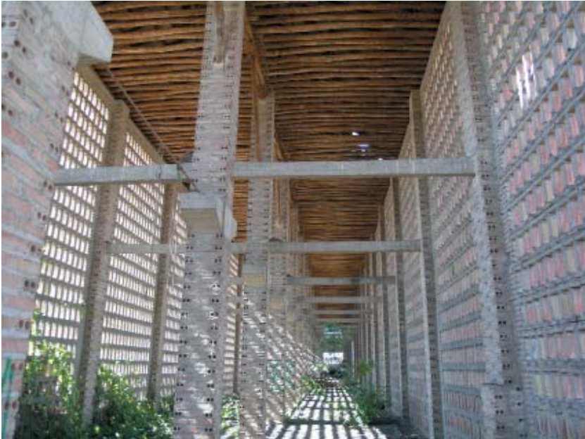
Imagen 4: Secadero de tabaco en la Vega de Granada (Purchil, Vegas del Genil).

proceso industrial de elaboración del tabaco, realmente forma parte de la actividad agraria, en este caso como labor correspondiente a la recogida y almacenamiento del cultivo previo a su comercialización o manipulación futura. En este caso sí debe ser considerado como patrimonio agrario [Imagen 4]. En cambio, un artesano que realice alpargatas de cáñamo, aunque las haga en el mismo territorio donde se cultiva el cáñamo, será un artesano y formará parte del patrimonio etnológico o inmaterial de la zona. La clave del Patrimonio Agrario debe ser, por tanto, la existencia de una continuidad (de tipo laboral, personal-familiar, social, territorial, económica) directa y necesaria entre todas las fases del proceso productivo; desde la preparación de la tierra o el ganado hasta la elaboración del producto o creación de la actividad objeto de protección.