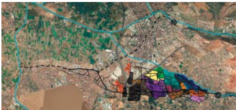
Imagen 10: Plano de la zona regable y turnos de riego, en la actualidad, de la Comunidad de Regantes de la Acequia del Jasin del Rio Monachil sobre ortofoto y parcelario catastral 2012.

principal es la selección, cultivo y mejora de las especies vegetales y animales, la domesticación en suma de animales y plantas para su conversión en alimentos o fibras, lo cual constituye uno de las grandes invenciones de la humanidad, fruto de la acumulación e intercambio de saberes y de una lenta y atenta experimentación. La otra son los sistemas hidráulicos de riego [Imagen 10]. El diseño, creación y gestión de los sistemas de riego para la explotación agraria de un territorio constituye una de las grandes aportaciones del conocimiento humano. Implica no sólo conocimientos técnicos de carácter hidráulico para extraer, contener o guiar el agua por territorios muy diversos y a veces muy extensos, sino que conlleva la creación de todo tipo de infraestructuras y elementos constructivos y, sobre todo, una compleja organización social para la creación, mantenimiento y gestión del sistema hidráulico. A todas estas aportaciones debemos unir quizás lo más valorado desde la perspectiva actual, el profundo conocimiento de la tierra y su respetuosa adecuación a ella, a pesar de su domesticación a través de pozos, norias, acequias, terrazas, cultivos, etc.