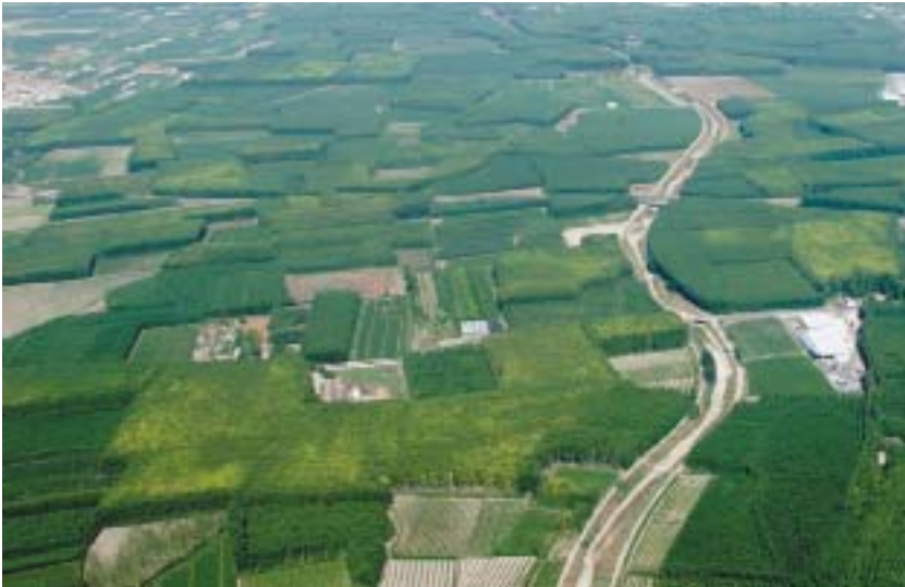
Imagen 16: Panorámica aérea de la Vega de Granada. Elaboración propia.

No obstante, en relación a esta figura de paisaje cultural y similares nos encontramos con una situación realmente compleja y contradictoria que está provocando mucha confusión en cuanto al alcance y viabilidad de su utilización.