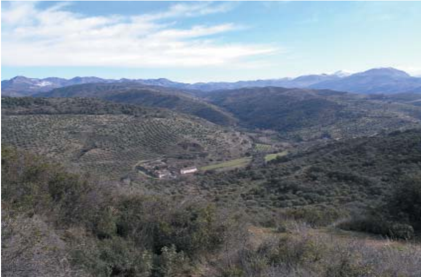
Imagen 7: Hacienda Jesús del Valle (Granada). Antigua explotación agraria de la orden de los Jesuitas. Elaboración propia.

Este irrenunciable principio de la tutela nos lleva a una aparente contradicción derivada del hecho de que el patrimonio agrario reconoce como valores principales, tal y como ya hemos comentado y detallaremos posteriormente también, los relacionados con las prácticas agroecológicas, donde la coevolución o la sostenibilidad son esenciales. Para evitar esta aparente contradicción tenemos que tener en cuenta la distinción que debe hacerse entre la actividad agraria como elemento constitutivo del patrimonio agrario (que significa que todo objeto protegido debe serlo por su vinculación con esta función, aunque ésta ya haya desaparecido o nos parezca inaceptable desde los parámetros actuales como una villa romana que utilizaba esclavos para cultivar el campo) y la actividad agraria como práctica defendible desde el Patrimonio Agrario, tanto para protegerla en aquellos casos que todavía persista (como en tantas zonas de los países en vías de desarrollo) como para implantarla en algún territorio que se quiera proteger y en el que estas prácticas ya estén muy alteradas. En el primer caso, la protección iría destinada fundamentalmente a los objetos o bienes considerados singularmente (un cortijo, un arado, una hoz, un cultivo) y el valor reconocido sería fundamentalmente el histórico (en