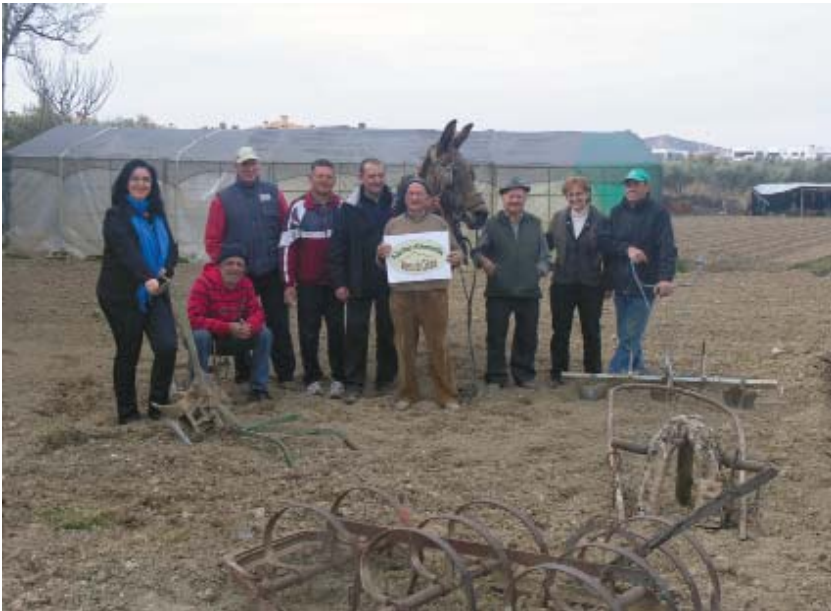
Imagen 8: Agricultores y técnicos que participan en el proyecto de recuperación de la agricultura tradicional en Alhendín, Granada, NaturAlhendin.

5. Esto no es inconveniente para que reclamemos, más como objetivo que como exigencia ineludible, las posibilidades económicas que tendría la vuelta a los sistemas tradicionales, como por ejemplo, la utilización del mulo como fuerza de trabajo. Aunque pueda resultar ridículo, el « hecho a mulo », en un momento determinado podría convertirse en un sello de calidad asociado a muchos principios y valores de la agricultura tradicional (esfuerzo, tiempo, contacto directo con la naturaleza, irregularidad, etc.). Reclamamos en este sentido la importancia y necesidad de la certificación, sea del modo más oficial o institucional de las marcas de calidad puramente economicistas como de los deseables sistemas participativos de garantía.