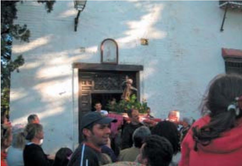
Imagen 11: Procesión de San Isidro Labrador en el pago de Darabenez en la Vega de Granada (Granada).