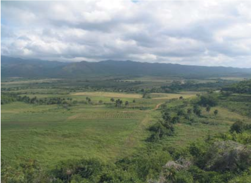
Imagen 17: Mirador del Valle de los Ingenios (Trinidad, Cuba). Paisaje Cultural Trinidad y el Valle de los Ingenios (Cuba), incluido en la Lista de Patrimonio Mundial en 1988. Elaboración propia.

Esta confusa situación en el plano teórico se está trasladando al ámbito operativo de la actuación sobre los paisajes culturales (a los espacios que se corresponden con esta tipología, aunque apenas si existen algunos que esté declarados como tales), ya que la predominante concepción generalista del paisaje está imponiendo sus mecanismos de actuación a través de la remisión a los instrumentos de ordenación y gestión del territorio, en definitiva el planeamiento. La reclamación de estos instrumentos como máximos mecanismos de actuación en el paisaje, también en los culturales pues no son más que una manifestación singular de aquellos, lo que está provocando no es tanto la instauración de un determinado sistema de protección sobre