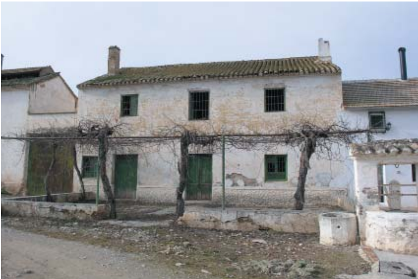
Imagen 13: Cortijo de Daimuz Alto (Valderrubio). Propiedad de la familia García Lorca de 1903 a 1908. Elaboración propia.

y pureza de espíritu, la sencillez, el sacrificio, la honradez, etc. lo agrario (como no, disfrazado de campo y naturaleza casi siempre) ha sido convertido en aspiración de modelos sociales, políticos y urbanos de muy diversa naturaleza, aunque casi siempre como rechazo y huida (en busca de la regeneración o el comienzo de una nueva era) de la realidad existente. Modelos cuya ideología o aspiraciones pueden ser diametralmente opuestas, ya que nos encontramos estos valores agrarios tanto en los fascismos (la regeneración del hombre a través de la vuelta al campo defendida por el Franquismo es muy ilustrativo) como en todos los movimientos que fluctúan en torno a la Agricultura Ecológica y la Agroecología.