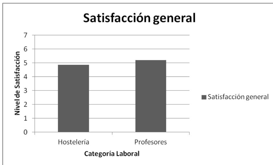
Gráfica 1. Comparación del nivel de Satisfacción Laboral en función de la Categoría Laboral (Alta vs. Baja).

Al analizar la asociación entre Satisfacción General y el tipo de Categoría Laboral se obtuvieron los siguientes resultados, mostrados en la Gráfica 1. También se puede observar en el gráfico que la media en nivel de satisfacción general es levemente mayor en profesores que en camareros. Sin embargo, las diferencias obtenidas no fueron significativas [ t(45) = -1.066, p=0.292 ].