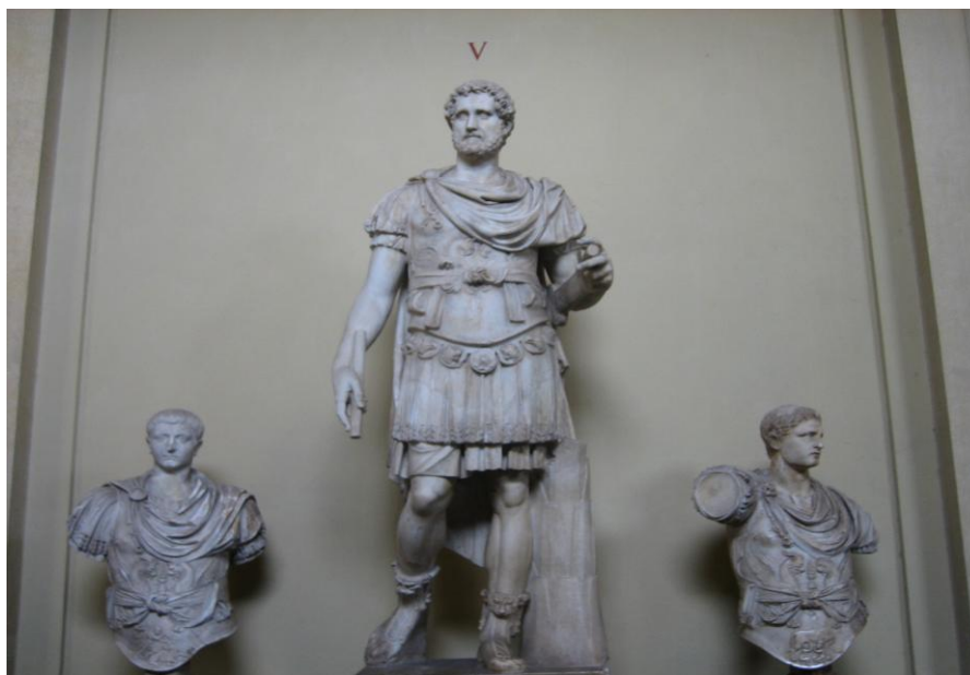
Roma. Biblioteca Vaticana.

Ante todo, quiero a la par que felicitarles por el inicio del nuevo curso, tener la ocasión de dirigirme a Uds. para presentarles la asignatura de DERECHO ROMANO , dirigida a los alumnos del GRADO EN DERECHO , para completar la información que probablemente ya tenga en su poder a través de la “ GUÍA DE ESTUDIOS DEL CURSO ACADÉMICO 2015/16 ”.