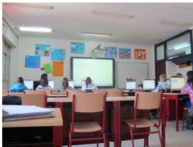
Figuras 3 y 4. Pupitres de los alumnos y pizarra digital, IES Galileo Galilei, Comunidad de Madrid

Los profesores valoran muy positivamente el que los alumnos dispongan de un espacio para poder apoyar el libro de texto, recurso didáctico al que se aferran.