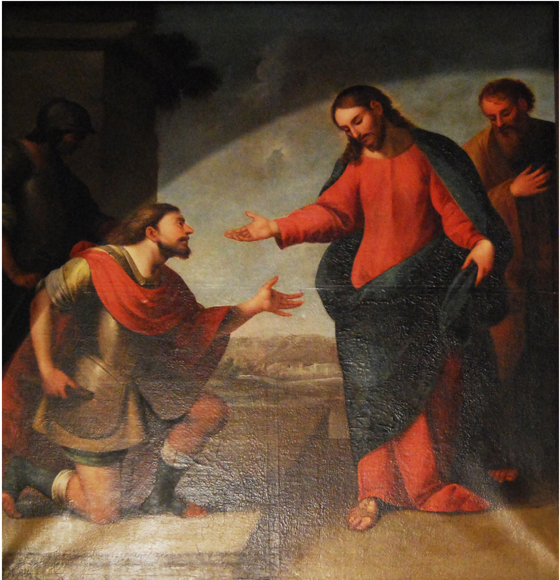
1. Diego DE OJEDA. La curación del siervo del centurión . Iglesia de los Hospitalicos, Granada.