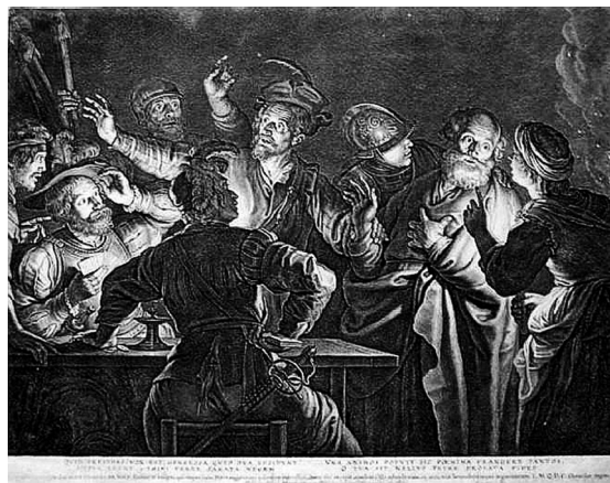
4. Schelte Adams BOLSWERT. Negación de san Pedro . Grabado sobre composición de Gerard Seghers.