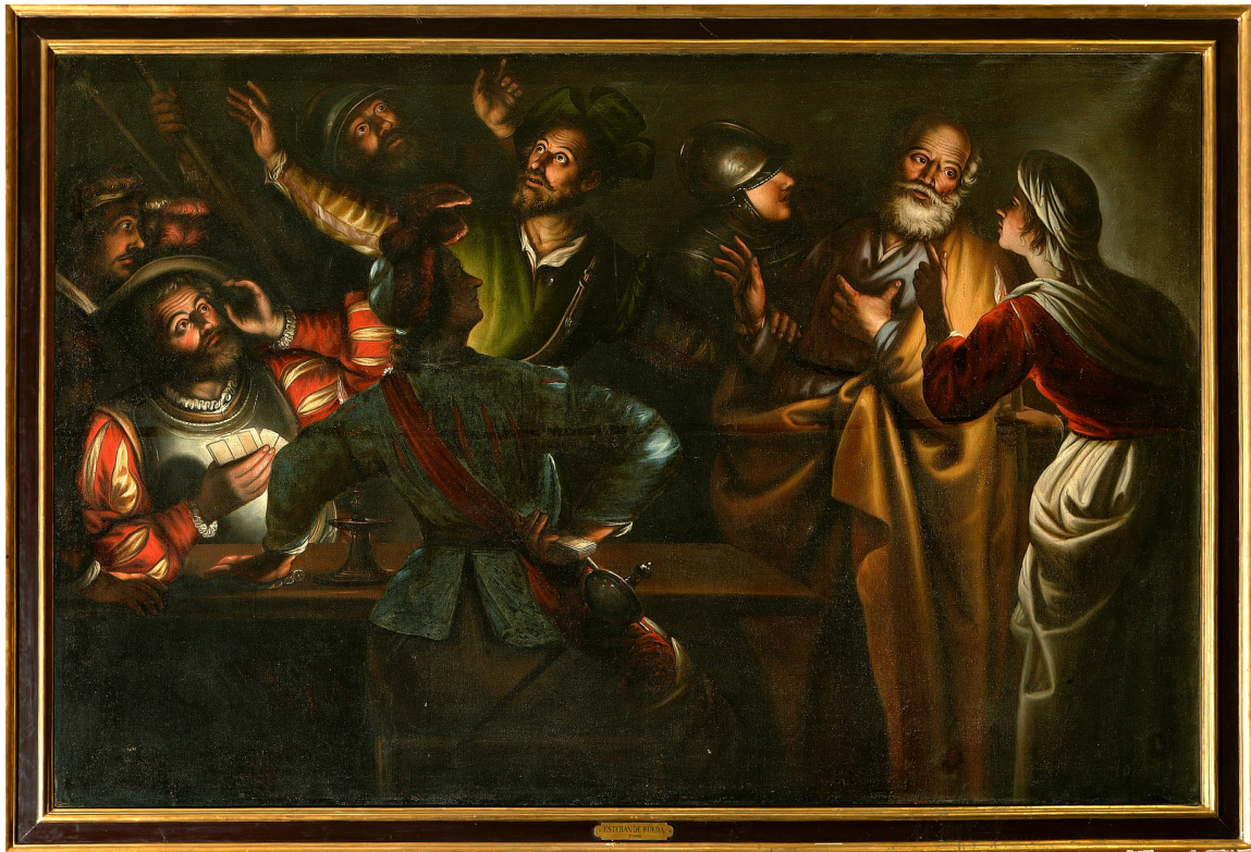
3. Esteban DE RUEDA. Negación de san Pedro ..