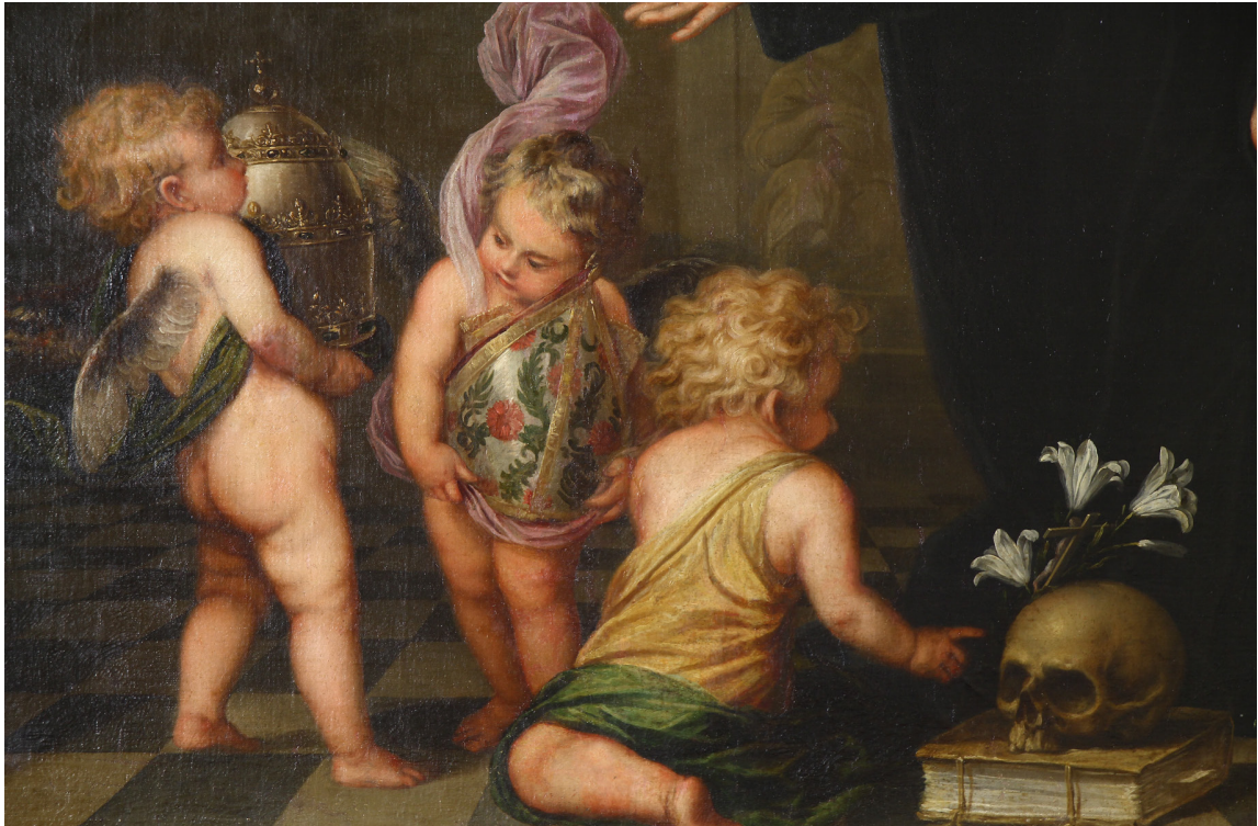
6. Pedro Atanasio BOCANEGRA. La visión de san Felipe Bonifacio. Detalle. Iglesia parroquial de San José, Granada.