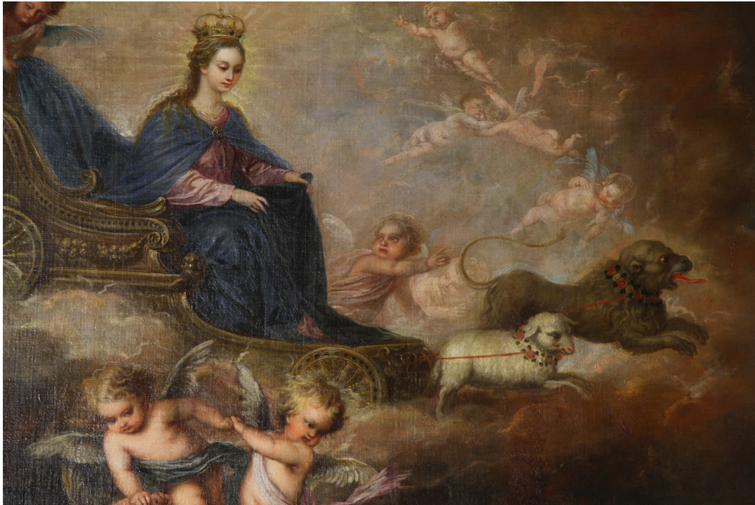
7. Pedro Atanasio BOCANEGRA. La visión de san Felipe Bonifacio (Detalle). Iglesia parroquial de San José, Granada. (Fot. Artelmagen).