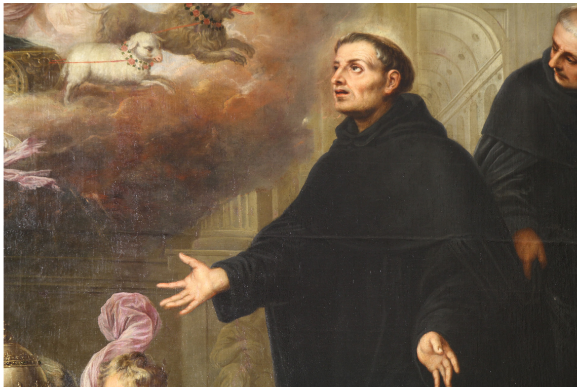
8. Pedro Atanasio BOCANEGRA. La visión de san Felipe Bonifacio (Detalle). Iglesia parroquial de San José, Granada.

sivo ascenso del artista decidieron mudarse a la de San José en la que permanecerían unos 5 años hasta que a la muerte del Racionero, Bocanegra decidió trasladar su taller en 1667 a la ciudad baja en 1667, más concretamente en la calle Boquerón, si bien durante breve tiempo ya que la familia retornaría en 1670 al Albaicín, aunque esta vez a la demarcación parroquial de San Miguel justo en el inicio de su etapa más fecunda 49 . A partir de 1677 compartiría el mismo domicilio del pintor el eclesiástico Juan de Rojas y desde 1683 la calle donde el maestro vivía comenzó a denominarse popularmente de «Atanasio» y más tarde de «Bocanegra».