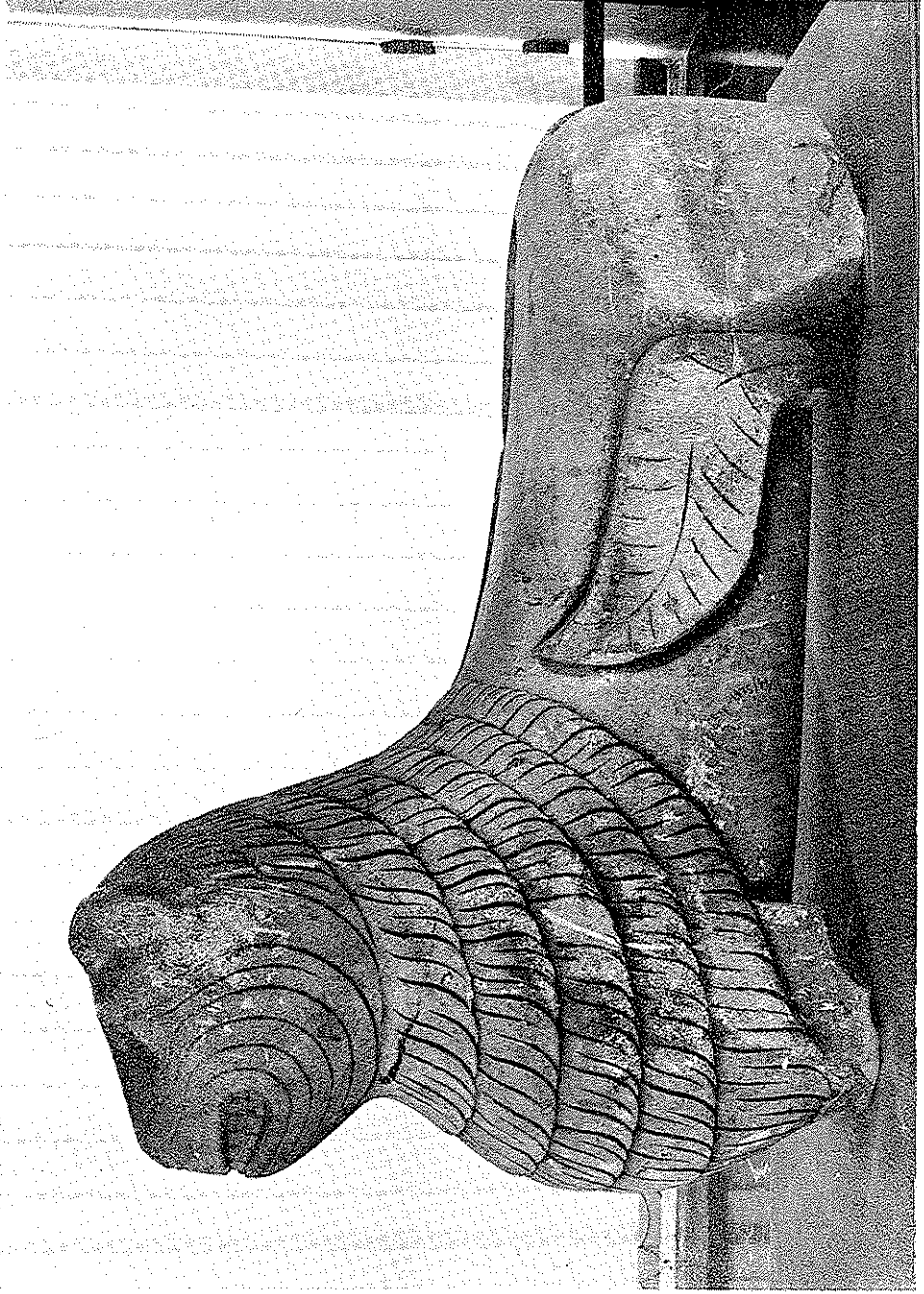
Lámina II, b.—Vista lateral del león de época romántica con su cola adosada