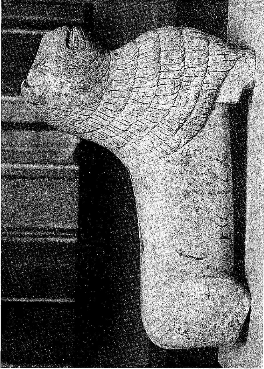
Lámina II, a.—Vista lateral del león de la época romántica