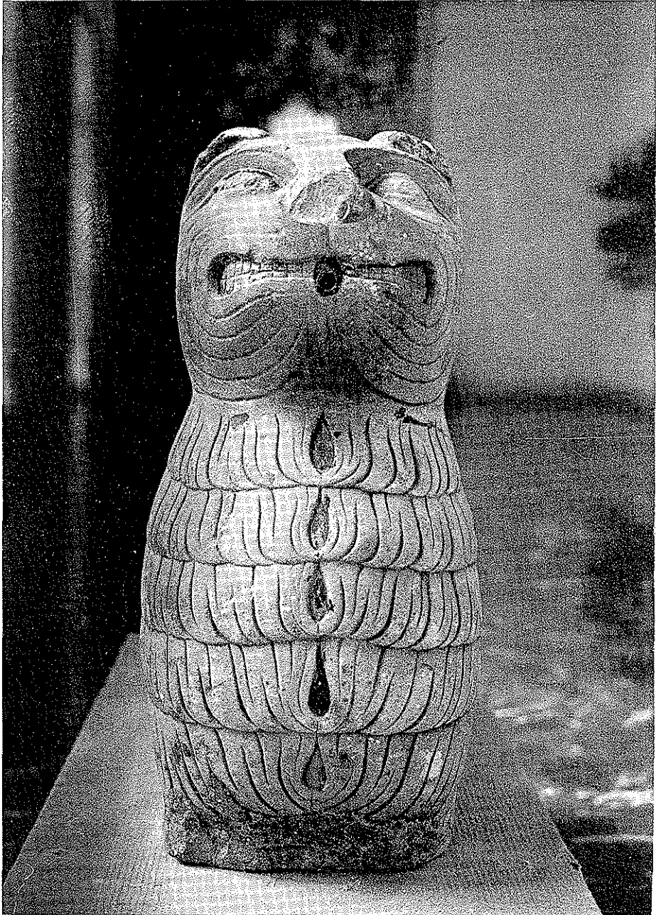
Lámina I, a.—León de época romántica, copia de los de la fuente de los Leones