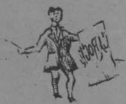
CUADRO NÚM. 1.

Para sembrar beneficios, castigar muchos desvirtues y evitar grandes perjuicios, la crítica de los vicios es voy á hacer en refranes.