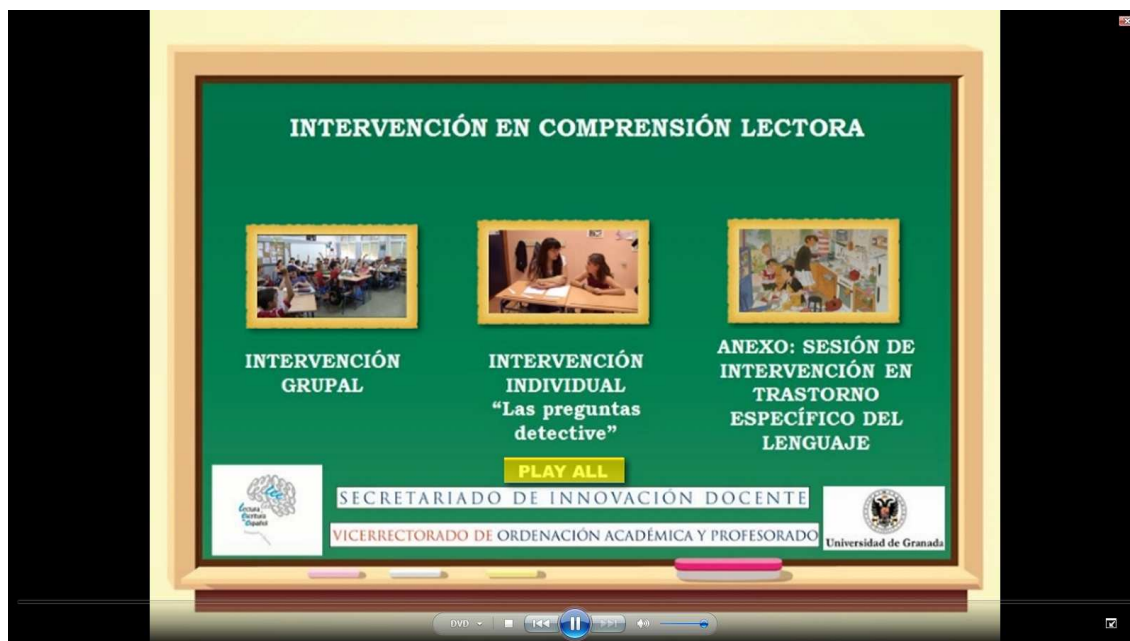
Ejemplo de submenú