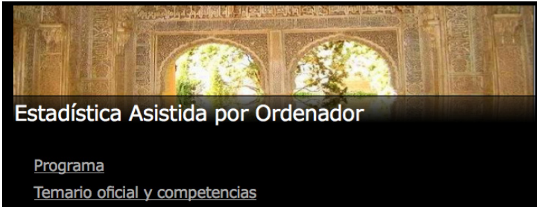
Figura 1: Página web de la asignatura

Se han elaborado un considerable número de ejercicios prácticos resueltos con los que el alumno aprende progresivamente a resolver problemas estadísticos con el paquete Statgraphics. Este software constituye una herramienta útil y atractiva y que junto al material didáctico elaborado, puede facilitar de forma ágil y efectiva el aprendizaje autónomo de Estadística. Asimismo se han preparado ejercicios propuestos, que sirven de evaluación del aprendizaje realizado.