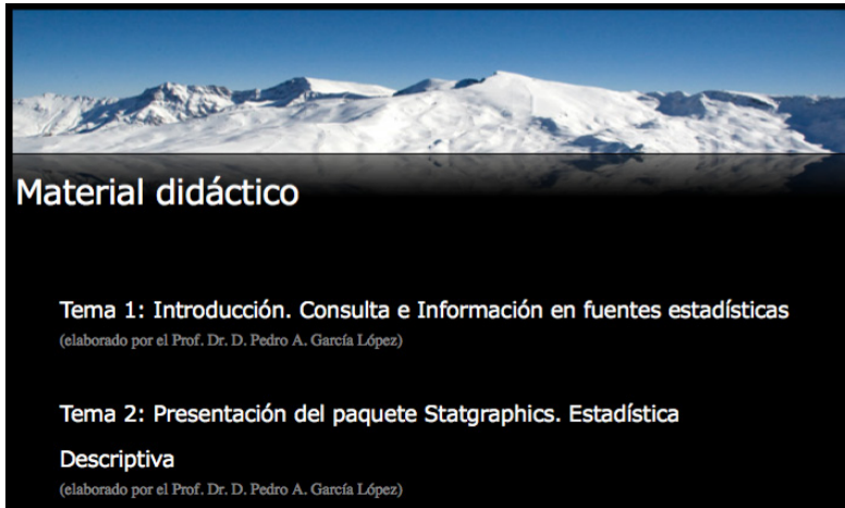
Figura 2: Material didáctico

Asimismo, consideramos apropiado el empleo de alguna herramienta genérica de apoyo a la docencia, como puede ser el tablón de docencia o SWAD , ya que puede ser útil como complemento y apoyo a la metodología en la que hemos trabajado.