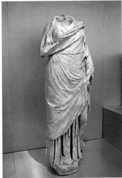
Escultura de matrona procedente de Baelo Claudia (Cádiz, España).

La intervención arquitectónica y ornamental de Iunia Rustica no se limitó al foro pues también acometió otra importante infraestructura cívica como los baños con la cesión del suelo, la construcción de unos pórticos y piscina para los mismos, y la dotación de una estatua de Cupido. La demostración de su poder e influencia en la ciudad se agrandó además con la decisión de pagar los vectigalia públicas. Su condición de sacerdotisa primera y perpetua del culto imperial, su pertenencia a una de las familias influyentes de la Bética y su decisión de adornar la ciudad con imágenes, como las estatuas de los dioses citados, que mostraban una estrecha vinculación con los modelos ideológicos romanos, hacen aparecer a Iunia Rustica como agente activo de romanización y de integración de su ciudad, Cartima, en el modelo cultural romano. Es