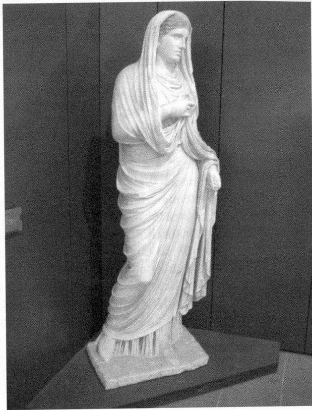
Escultura de Eumachia (Pompeya, Italia).

precisamente en los foros, cuando en la concepción tradicional de la ciudad éste era el espacio político y masculino por antonomasia. La oportunidad de construir en el área pública, y especialmente en el foro, era algo sumamente prestigioso que suministraba al patrocinador reconocimiento y estatus social, con un alto impacto en la ciudad y una gran influencia en la identidad cívica de la población. Además las construcciones públicas realizadas por personas individuales requerían el acuerdo del senado de la ciudad, lo que implicó, en el caso de las mujeres, la aceptación oficial de una situación extraordinaria y nueva para el propio orden político de las ciudades 25 .