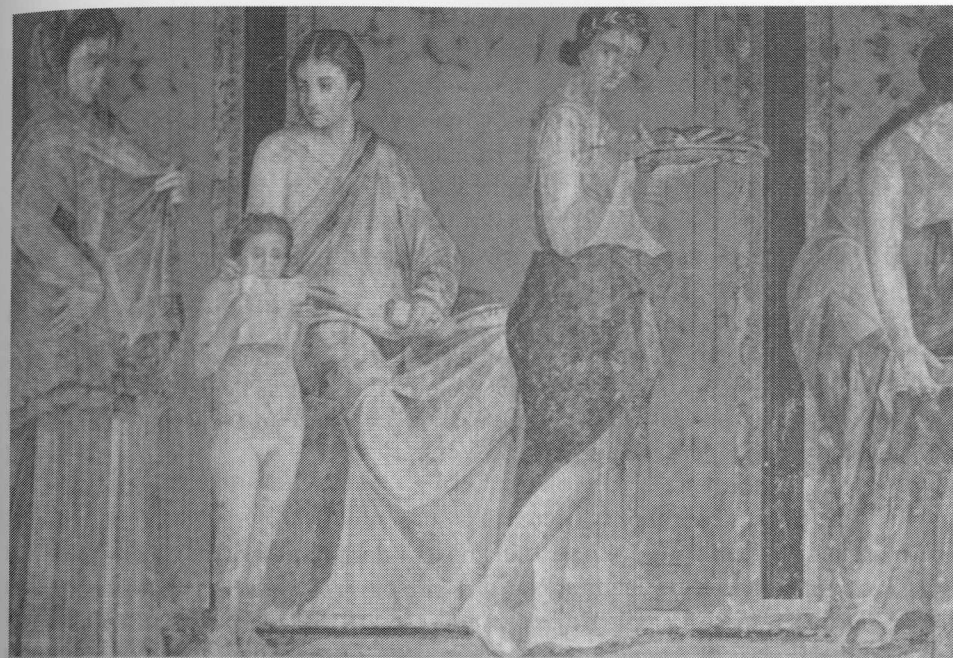
Escena de mujeres. Fresco de la Villa de los Misterios. Pompeya s. I a.C.

veintisiete vírgenes purificaron Roma con sus cantos ..."; "... tres coros de nueve vírgenes cantaron en Roma ..."; "... las matronas ofrecieron sus tesoros y las vírgenes los dones en honor de Ceres y Proserpina ..."; "veintisiete vírgenes entonaron los cánticos sagrados repetidas veces ..." 21 .