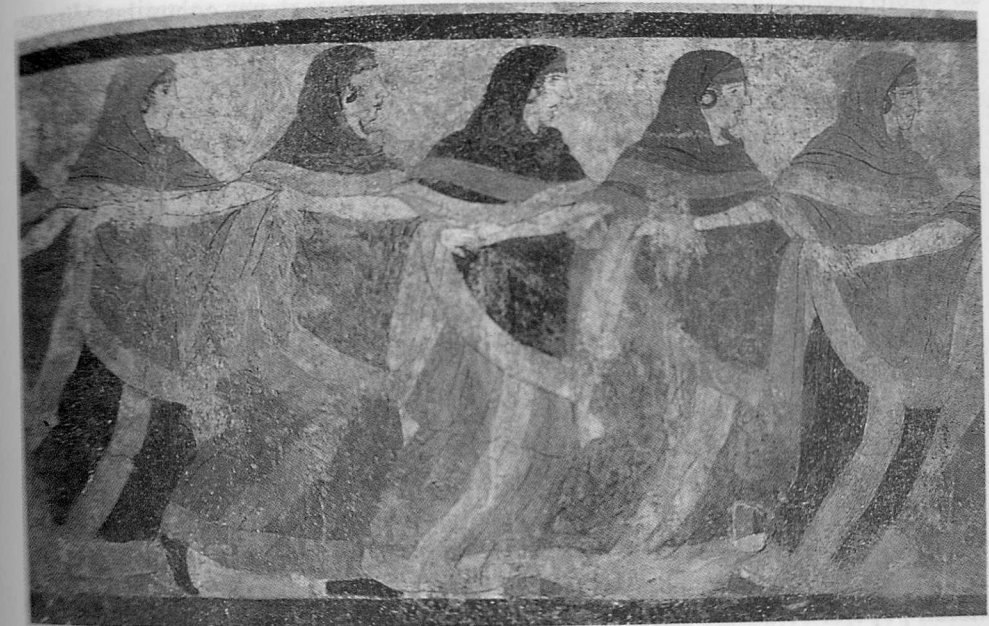
Coro de mujeres. Fresco de una tumba. s. v a.C. Museo Arqueológico Nacional. Milán.

Así pues, el delito y expiación de las Vestales se situaba dentro de la teoría romana de contaminación y culpabilidad por un lado, y de purificación por otro, elementos que juegan en la dialéctica de lo sagrado un papel fundamental 33 . Volvemos así a una idea anteriormente expresada, el contacto con lo impuro imprimía en el mundo romano una mancha peligrosa y abominable y todos los esfuerzos de los hombres y las ciudades debían de estar orientados a lavar ~ los individuos y a la sociedad, a purificarlos mediante una catarsis ritual apropiada.