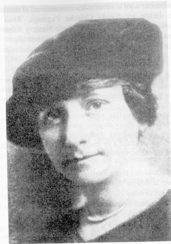
María de Maeztu.

rutina, han sabido hacerse personas sin dejar de ser mujeres. No se las ve, apenas se las oye, pero sin embargo, se las siente, y su acción, no por modesta, carece de trascendencia. Ejercitada por cada una en el campo limitado de las relaciones amistosas, forma insensiblemente el hábito de considerar a la mujer como algo más que vulgar ama de llaves o frívolo biblot d'etagère , y crea costumbres que con el tiempo convertirá el hombre en leyes 41 .