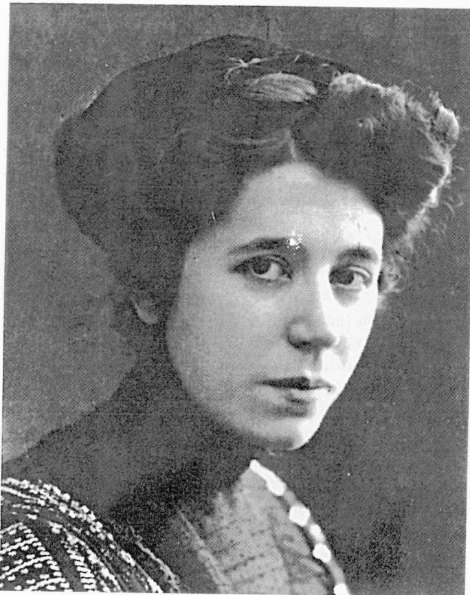
María de la O Lejárraga