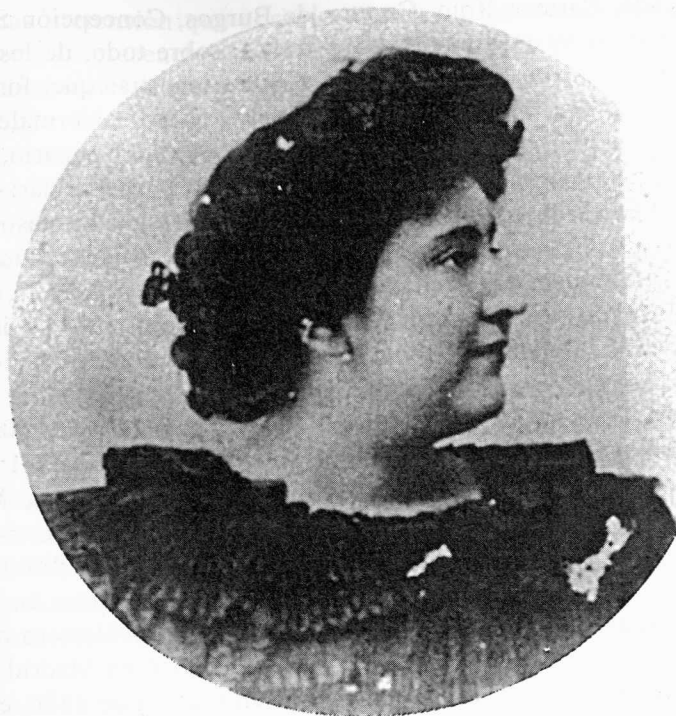
Carmen de Burgos.

No hay duda de que estas maestras tuvieron contacto entre sí y los espacios de confluencia fueron un elemento clave que permitió la comunicación de ideas, experiencias y el desarrollo de conciencia colectiva. No nos detendremos en sus trayectorias individuales 11 , todas muy activas y meritorias, sin duda singulares en la España de entre siglos, solo buscamos mostrar algunos datos sobre las características comunes, los espacios de encuentro, las conexiones entre ellas —que den pistas a futuros trabajos— para explicar como las redes, que sin duda establecieron, les dieron fuerza para ocupar y significarse en el espacio público.