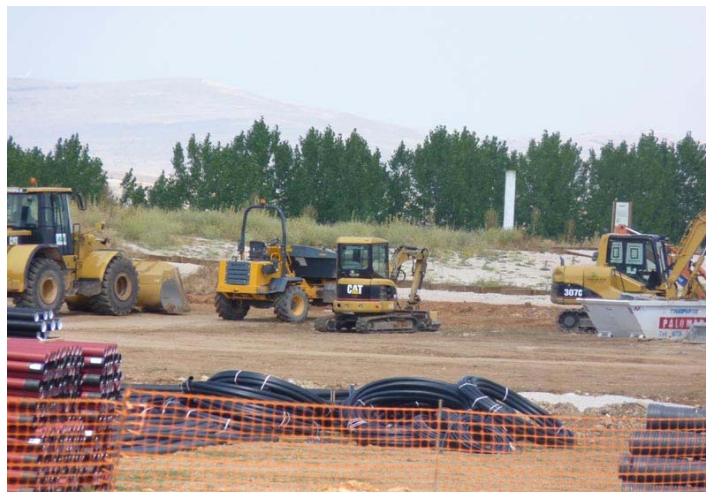
Excavadoras en el campamento Alto Real