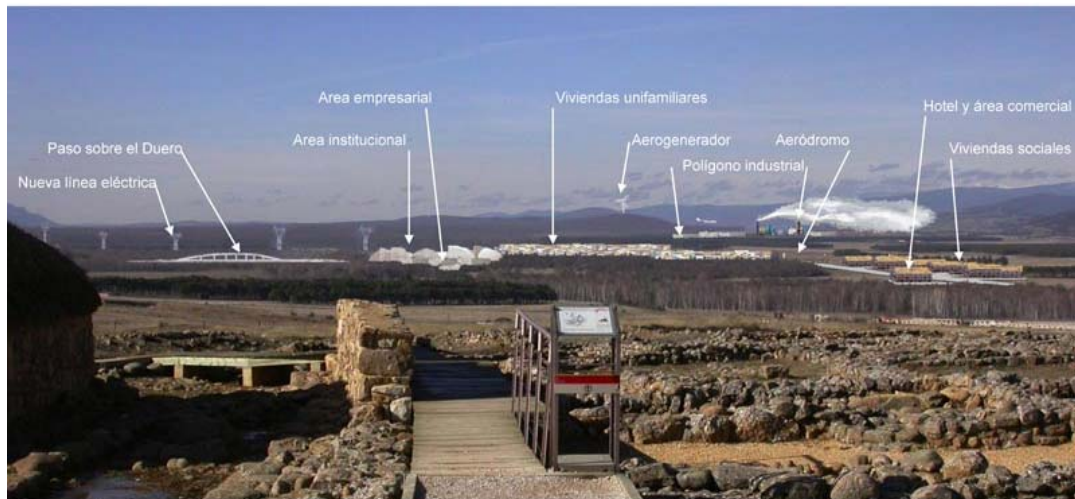
PANORÁMICA DEL SOTO DE GARRAY DESDE LAS RUINAS DE NUMANCIA GARRAY.SORIA. ENERO 2008.

Según el Gobierno castellano-leonés, se trata de un “proyecto integral de asentamiento humano”, al que se destinan 560 ha. y 500 millones de euros, “compaginando el desarrollo económico de la zona con el máximo respeto posible al valioso entorno natural que lo rodea”. Éste incluye distintos “campus”: tecnológico, industrial e institucional; de hábitat experimental, con 780 viviendas; residencial-transeúnte (lo que supone la creación de 300 plazas hoteleras); cultural arqueológico (puesta en valor de una necrópolis medieval), deportivo (ya hay un equipo de voleibol llamado “Ciudad del Medio Ambiente); y parque fluvial y lacustre del Duero [Ilustración 3].