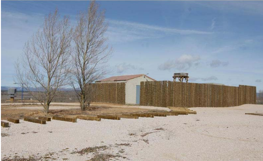
Ilustración 5. Reconstrucción del campamento de Alto Real.