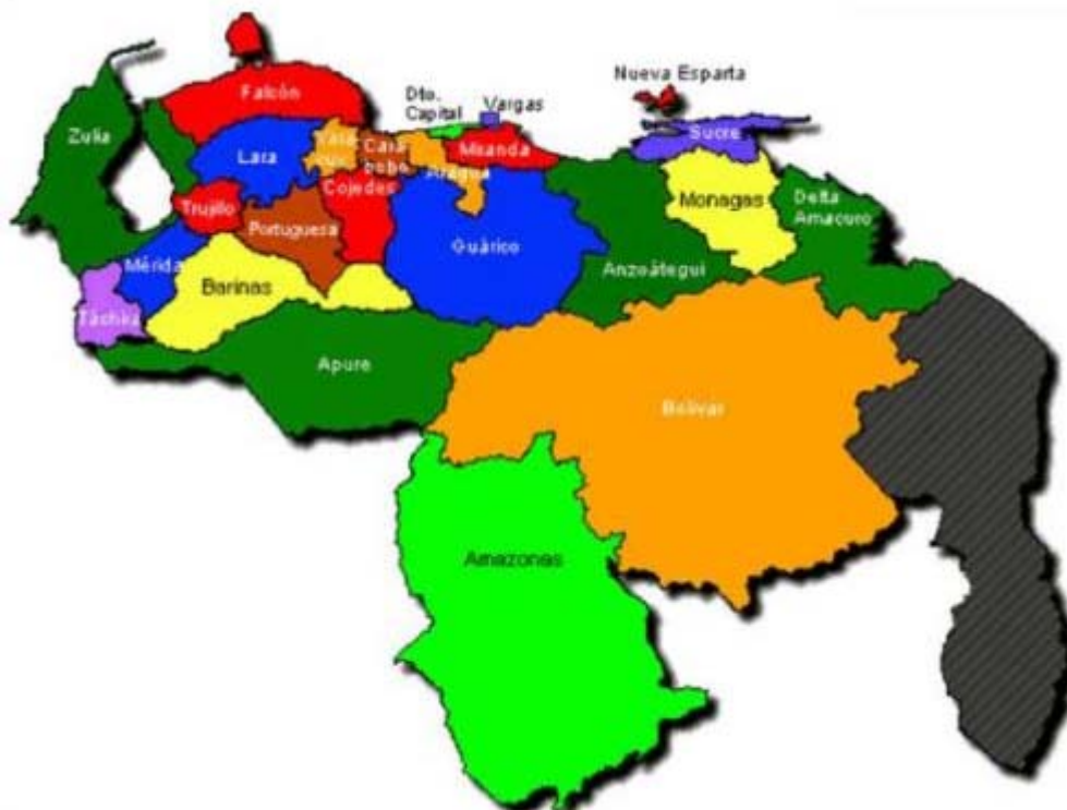
Figura 1. Ubicación geográfica de la Costa Oriental del lago.

Su ubicación y geografía es además conveniente para una posible ruta de tránsito para los grupos prehispánicos ya que la comunicación por vía lacustre, fluvial o terrestre no presenta mayores obstáculos naturales. De igual manera, dicha ubicación representa un sitio estratégico en cuanto al control y disposición de recursos.