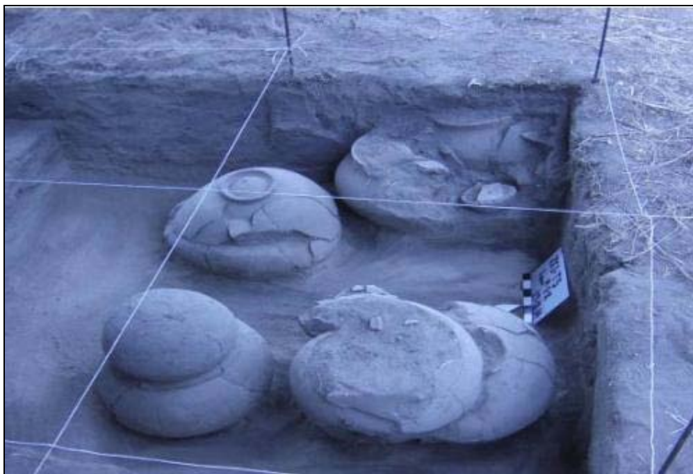
Figura 3. Yacimiento arqueológico en el sitio de la Mesa. Municipio Cabimas.

Relación que establecen los pobladores con el patrimonio arqueológico prehispánico (1)