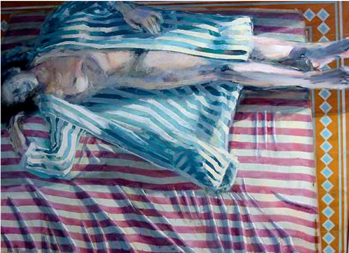
Juan García Villar. Alegoría II. Sobre la soledad . Temple-Oleo, sobre Lienzo. 1,90x140 m.