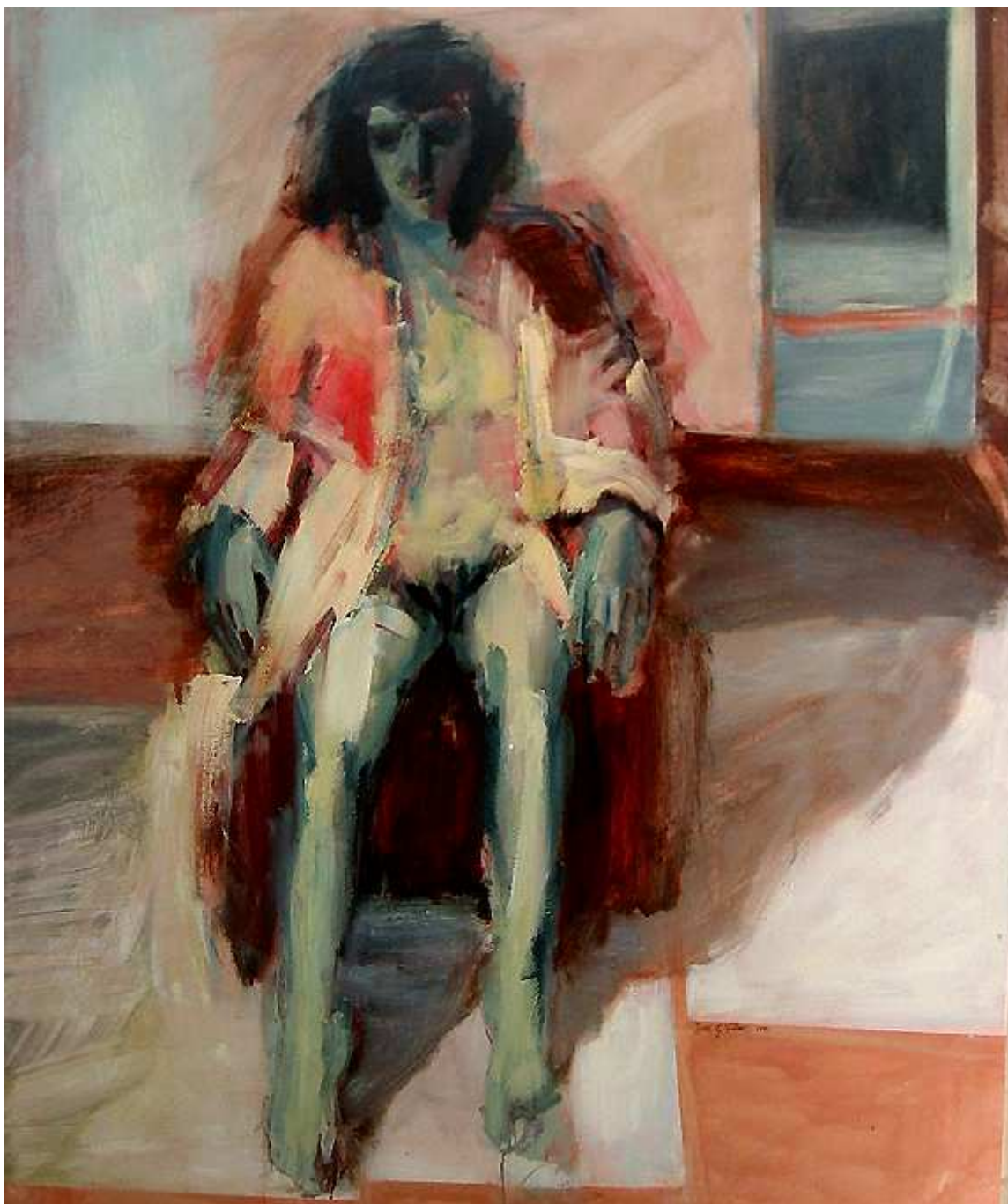
Juan García Villar. Figura II. Desnuda . Temple-Oleo sobre Lienzo. 1,80x150 m.

Sí, acérquense al color con el ánimo de escucharlo y gozarlo como si de música se tratase; analicen la forma a partir de una lectura poética de ritmos, que al encadenarlos nos descubren un poema; sensibilícense con los gestos expresivos a modo de firmas autobiográficas que revelan la verdad y la búsqueda de cada pintor.