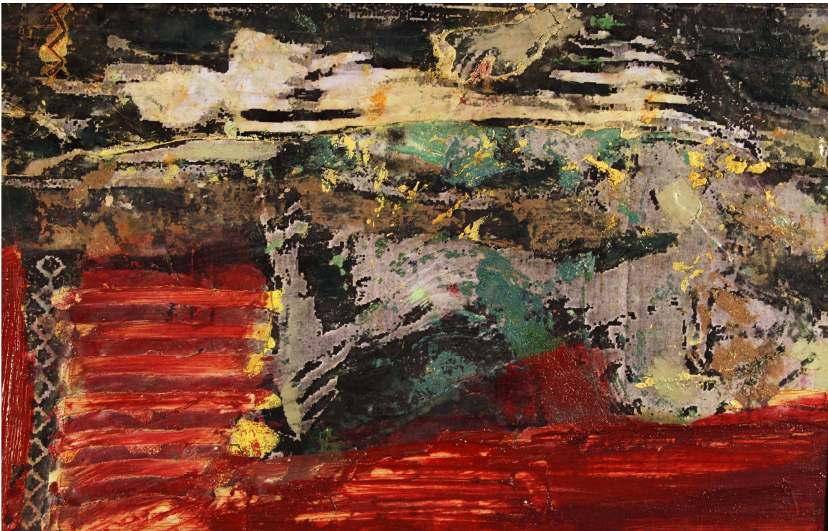
Juan García Villar. Proceso Abstracción I. Alegoría II. Sobre la soledad . Temple-Oleo sobre tabla. 0,23x0,33 m.

Hay espectadores que viven la pintura con la intensidad que el artista, y lo cierto es que nosotros los pintores nos sentimos realmente a gusto y en armonía con esos admiradores, con los cuales compartimos el mismo entusiasmo y sensibilidad hacia el cuadro. También encontramos, y a veces descubrimos, a otros muchos entusiastas seguidores que no sólo se conmueven ante la superficie compuesta de color, luz y sustancias aglutinadas, sino que además saben interpretar y traducir ésta como una gramática pictórica, y, en definitiva, como la resonancia de los sentimientos y las reacciones reflejas del autor. Es cierto que para los artistas, la pintura es una entrega apasionada que tiene su origen en lo ancestral, siendo al mismo tiempo un lenguaje autónomo y articulado que se alimenta del conocimiento inteligente de la realidad, y de la libertad del hombre como ser espiritual y perceptivo.