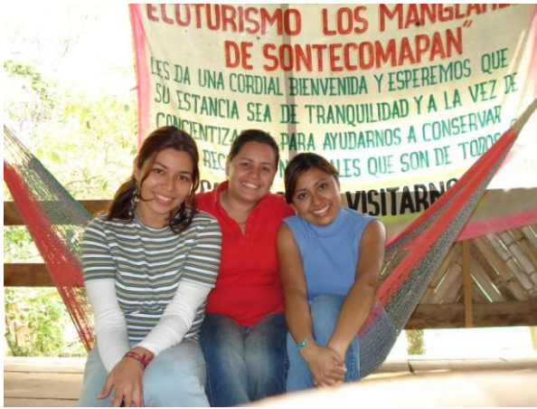
Microempresa y grupo de estudiantes de investigación