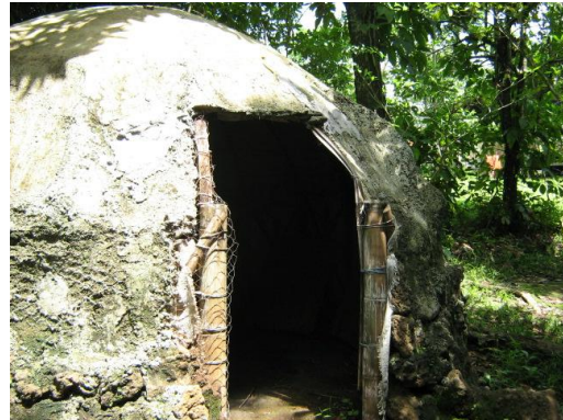
Foto: temazcal 2008