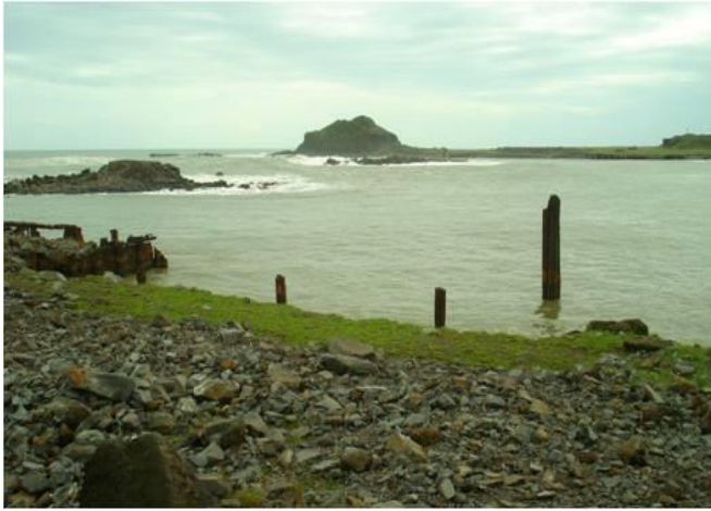
Estero de Balzapote