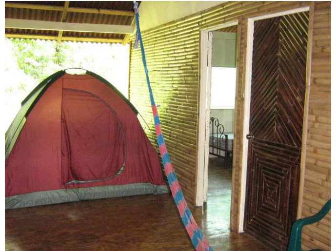
Tienda de campaña, inicios de la microempresa