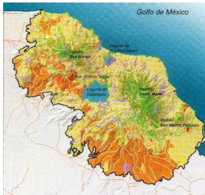
Mapa No. 8

Forman parte los municipios Ángel R. Cabada, Santiago Tuxtla, San Andrés Tuxtla, Catemaco, Sotapan, Mecayapan, Tatahuicapan de Juárez y Pajapan. Los límites del área protegida empiezan al este, en la costa del Golfo de México en Punta Puntillas, al norte limita con el Lago Catemaco y al sureste con la zona Federal Marítimo Terrestre en la costa del Golfo de México.(Mapa No. 6)