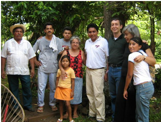
Actores locales y grupo de investigación