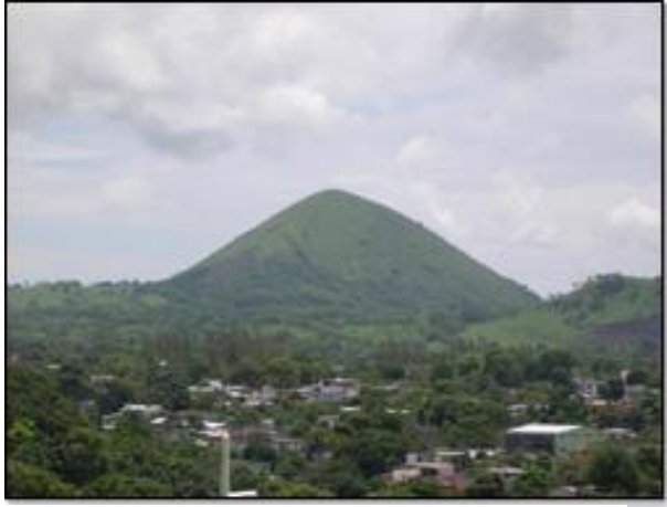
Panorámica de la zona de estudio