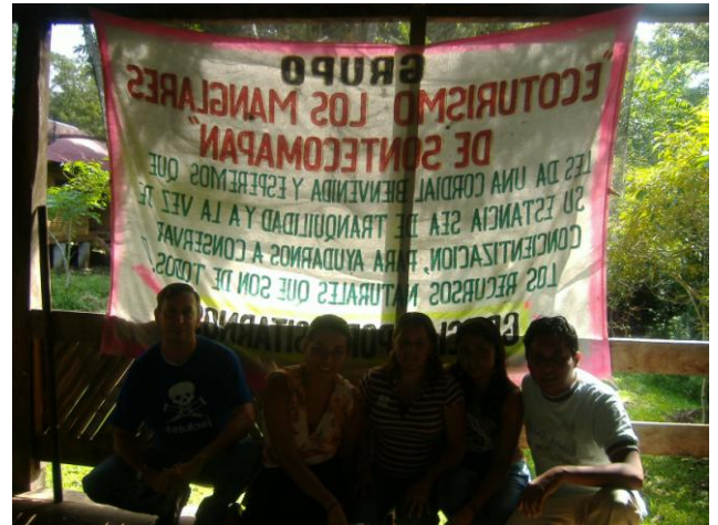
En la microempresa