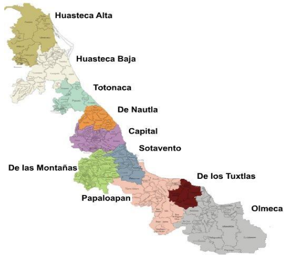
Mapa No. 3

El territorio de Veracruz abarca 71820 km. 2 , representa el 3.7% de la superficie total de México.