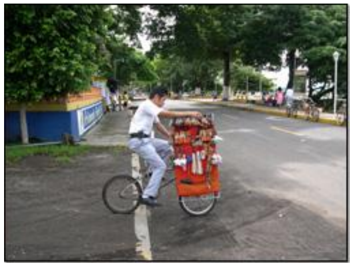
Calle de Sontecomapan