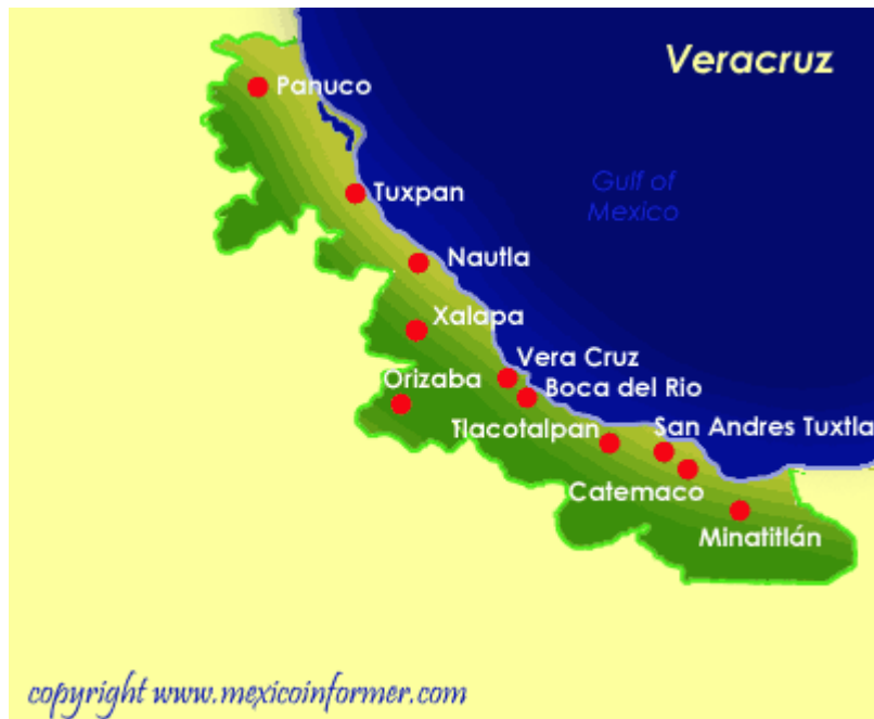
Mapa No. 4

En base a su territorio los principales municipios son: