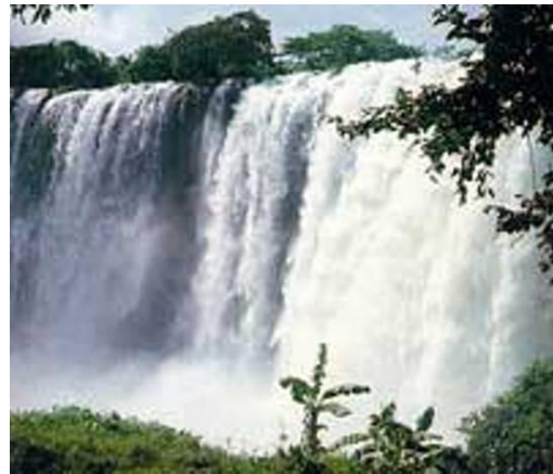
Foto: Salto de Eyipantla

Ante esta riqueza natural el gobierno federal en el año de 1998 decreto la Reserva de la Biosfera de los Tuxtlas, para preservar el medio ambiente y a sus pobladores, dentro de un enfoque de desarrollo sustentable.