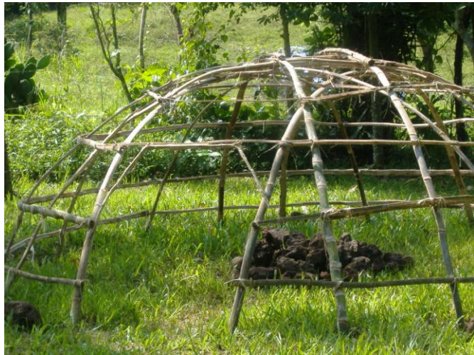
Temazcal estructura típica