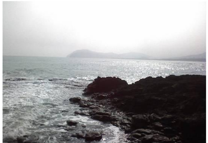
Estero de la playa Monte Pio