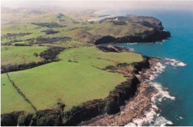
Laguna de Sontecomapan