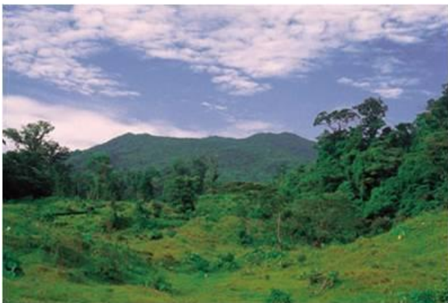
Volcán de Santa Marta