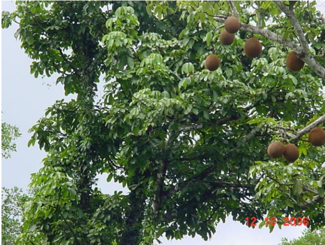
Árbol, semillas para artesanía