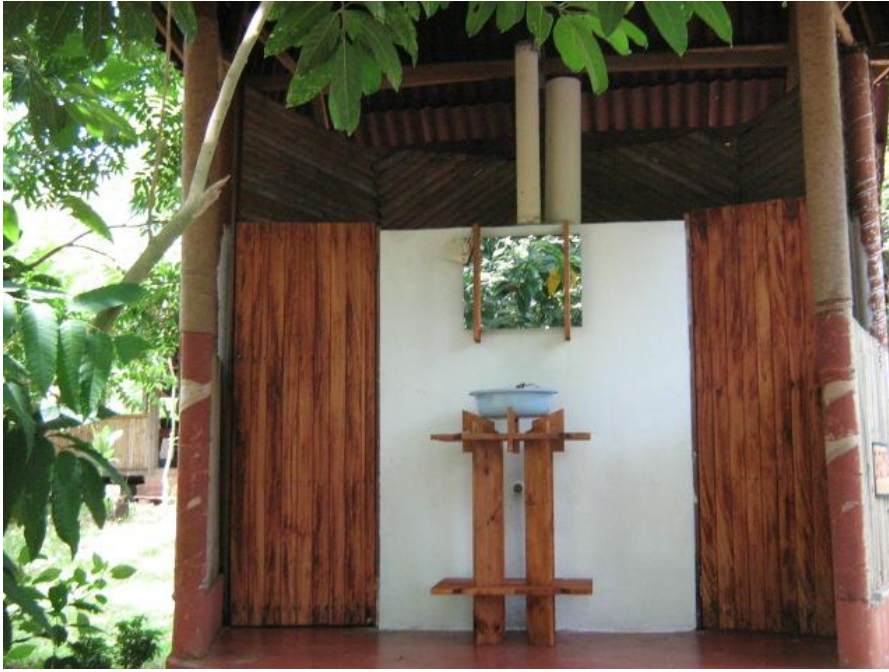
Baños secos, sistema de ecotecnias