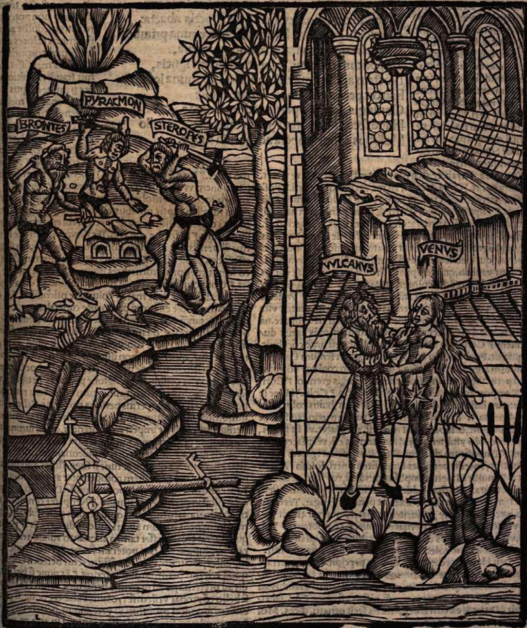
Virg. Iij ij Seruius

(Carinis.) In Roma, cod. legif, cauernis, errore scedo. f̄ Subter fall. te. In gētē Æneā duxit.) In co. aliquot ant. subest, legif. sed, subter. lecho castior vr. ar. In gētē Æneā duxit, ip̄secta rit ofo. f̄ Aspirat.) In aliquot an. co. inipirat. Sed & adpirat, iuenif: qd̄ nōnullis placet. f̄ Opis ve.) In ant. aliquot co. opusue: vt sit, Ar- ma, opusue artis tuę. Nā nō tā armoz p̄fidū, q̄ et artificij vifen- dam pulchritudinē, admirabitur poeta, in armis ipsis. Est etiam, opis q̄, legere. f̄ Imperijs Rutuloꝝ.) In Oblon. cod. & qbusdam alijs ant. imperio, vnitatis numero, legitur: qd̄ etiā apud Ser. ad uertas. Missum vero faciam, qd̄ in plerifq; co. & hic, & alibi, Ru- tiloꝝ, secūda syllaba per i, nota. f̄ Genitrix.) Ex anti. co. scriben- dū, genitrix, media syllaba per e. vt alibi monuimus. f̄ Nerei.) In co. aliquot ant. Neerei, legit. In nōnullis Neres. Super quo de clinatu multa Ser. memorat. Prī. vero in hmōi noibus, positū, ait, datiuū pro genitiuo. Quare, Nerei, scribēdū erit. Sed, Neri, p̄ nūciare non incōgruū, facta syngrapha in u, Græcā diph.