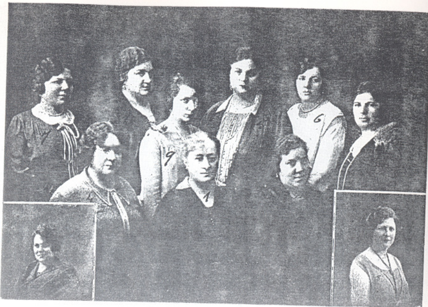
La Junta del Colegio de Comadronas de Cataluña