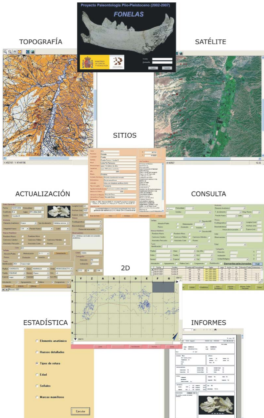
Figura 2. Galería de imágenes de la aplicación informática.