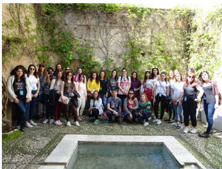
Imagen 13.1. Visita a los baños árabes en el itinerario por el Albaicín (Granada).

Los alumnos de 2.º del grado de Educación Primaria de la asignatura obligatoria de Didáctica de las Ciencias Sociales y de 4.º del grado de Educación Infantil de la asignatura optativa de Patrimonio Artístico y Cultural y su Didáctica, grupo A, con una edad comprendida entre los 21 y 22 años, por regla general, realizaron durante el primer cuatrimestre, de septiembre a diciembre, del curso 2019-2020, las siguientes visitas a museos y monumentos de la ciudad de Granada. En el caso de los de Primaria, a: Museo de la Alhambra, Museo de Bellas Artes, Alhambra, Capilla Real e itinerario por la parte baja del barrio del Albaicín. Las del grado de Infantil, a: Museo Memoria de Andalucía, Museo de la Ciudad Casa de los Tiros, itinerario por la parte alta del barrio del Albaicín y al Monasterio de la Cartuja.