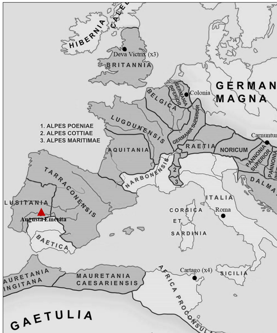
Figura 7: Movilidad de los emeritenses fuera de la península ibérica. (commons.wikimedia.org/wiki/File:RomanEmpire_117_es.svg. y elaboración propia)

parte de la deductio de Augusta Emerita , decidiendo posteriormente abandonar la ciudad para establecerse en el territorio de estas colonias vecinas, quizás como consecuencia de los lazos sociales o familiares creados tras su retirada. Esta misma dinámica se observa también en periodos posteriores, donde conocemos a varios veteranos que decidieron establecerse en los alrededores de Mérida, como C. Iulius Gallus , que tras finalizar su servicio en la legio VII se retiró en Elvas, o el pretoriano L. Pontius Aquila , que falleció en Artigi . Otros, sin embargo, optaron por asentarse en las ciudades donde quizás habían servido, como Tarraco , o en comunidades que ofrecían interesantes oportunidades de ascenso social, como Colonia Patricia , donde conocemos al aquilifer M. Septicius , o Barcino , donde destaca el caso del centurión L. Caecilius Optatus , que recibió una adlectio por parte del ordo local y desempeñó el duunvirato en tres ocasiones, dejando, además, un importante legado económico a la colonia.