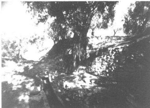
1. La red de acequias como elemento modificador del paisaje.

encontrar capítulos de dedicados a ella, pocas son las que abordan aunque sea puntualmente un análisis de algunos de los aspectos que la definen 4 . Fue por ello, por lo que nos decantamos por llevar a cabo una reactualización de los conceptos desarrollados acerca de su realidad y junto a ello, atrevernos con un ámbito como el de lo etnográfico que encierra más de una sorpresa 5 .