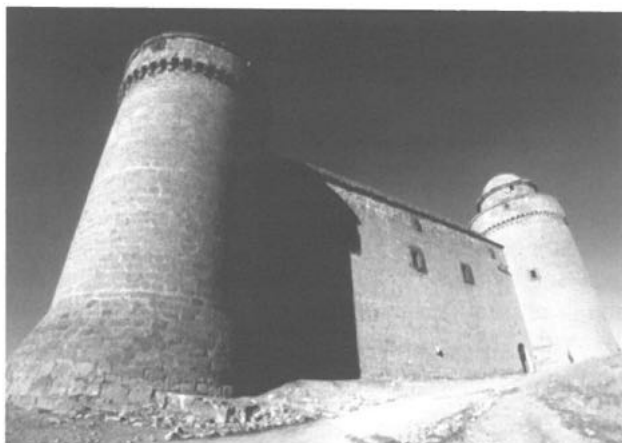
4. Volumen del castillo-palacio de La Calahorra en el Zenete.

mediante la difusión, que conforman la base de una futura consolidación de la conciencia cultural, no sólo por parte de los habitantes de la comarca, sino además para los innumerables visitantes que se acercan a conocer esta región de la provincia de Granada.