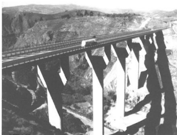
2. Impacto de las nuevas infraestructuras en el valle del río Dúrcal.

territorio y sobre todo poniendo las bases de lo que será un espacio temporal medieval, en el que se definirán la inmensa mayoría de los aspectos que hoy podemos diferenciar. A esto le tenemos que unir el gran número de acontecimientos que se suceden en el tercer cuarto del siglo XVI y que finalizarían con la sublevación de las Alpujarras desde 1568 hasta 1571, constituyéndose en uno de los capítulos más importantes de la historia Moderna de la Península 6 .