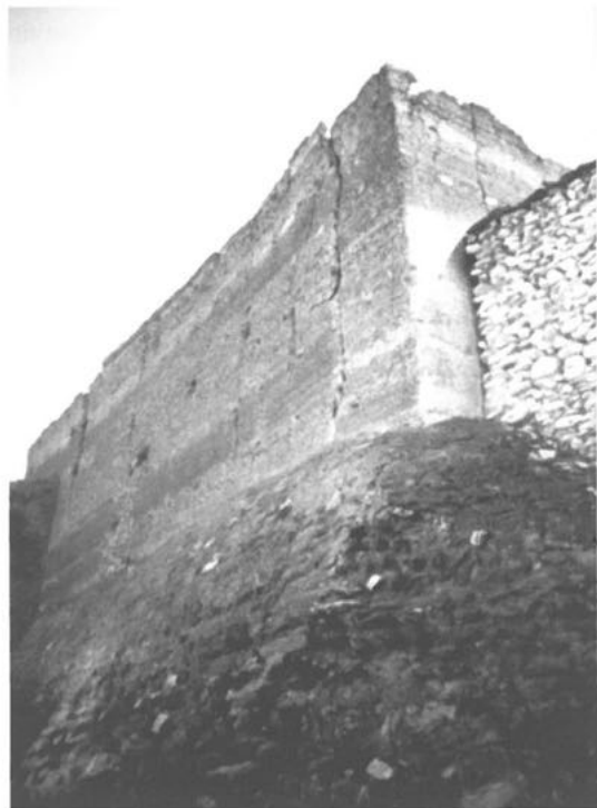
5. Inserción de los elementos militares en el viario. Castillo de Ferreira. Granada.

de cada propuesta de actuación sobre la población humana y la fauna, además de comprender la estimación de los efectos sobre los bienes materiales, el patrimonio cultural, etc.