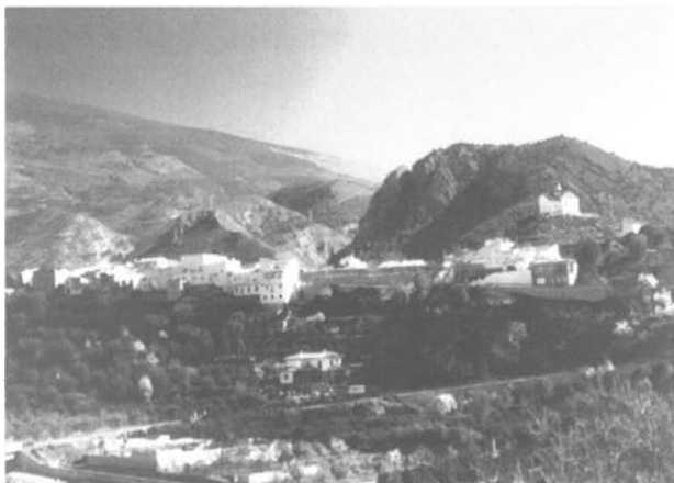
3. Vista de Talará con la ermita del Cristo del Zapato.

mente el siglo XVI hasta la actualidad. Urbanismo y arquitectura se conforman como la piedra angular del estudio de una realidad en la que aún se encuentran acciones, actividades, maneras de comportarse de sus habitantes, etc., que hablan muy a las claras de la importancia que encierran en sí mismas, más allá de la propia materialidad de la realidad. Una ordenación del espacio que participa de la concepción cristiana del transcurrir del tiempo con lo que la religión aparece como la regidora de los ciclos vitales rurales.