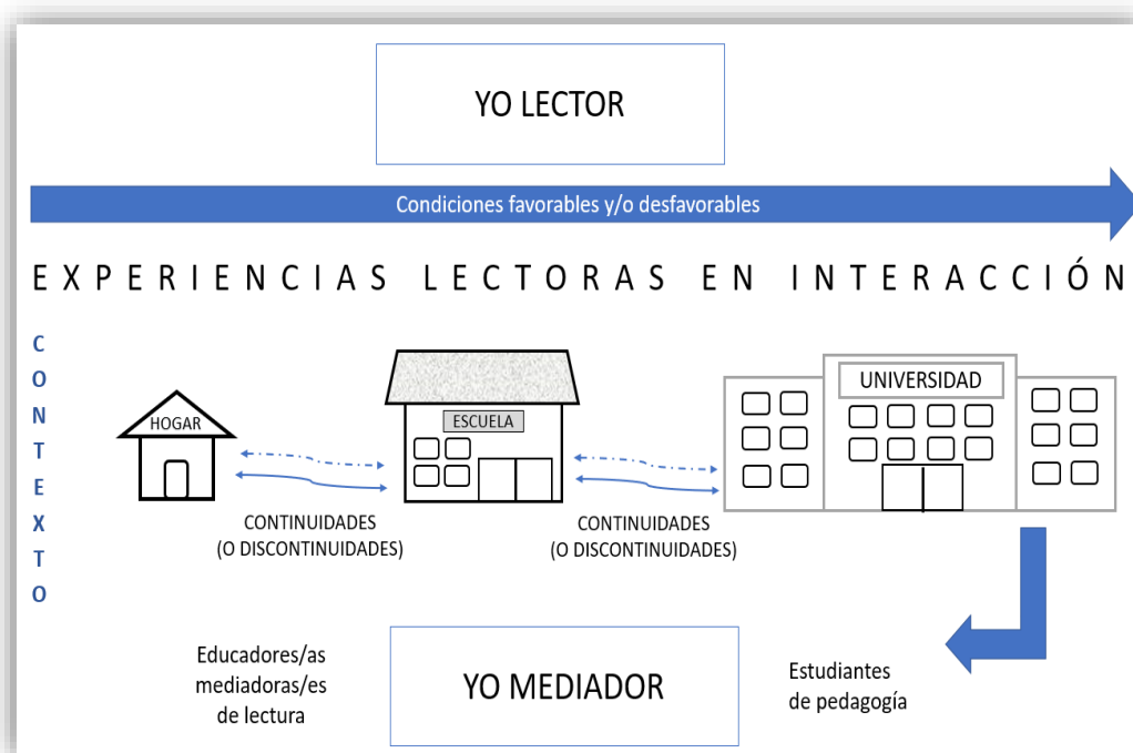
Figura 1: Tránsito desde el Yo lector al Yo mediador