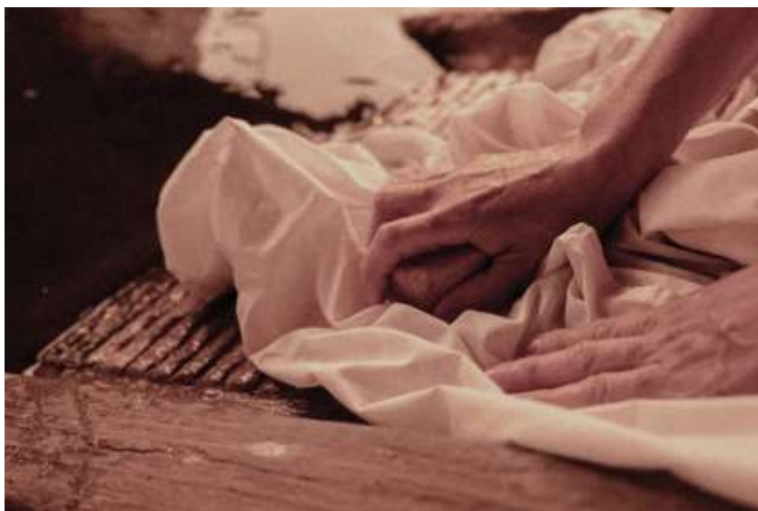
Imagen 1. Mujer lavando ropa. Autora: María Viñas 2022

Actividades también denominadas domésticas a las que se les atribuye un carácter negativo porque se considera que para realizarlas no se necesita tecnología, ni estudio, ni experiencia. Esto hace que las mujeres no sean importantes porque las actividades que realizan no lo son y que las actividades también carezcan de interés porque las personas que las realizan no son importantes para la sociedad (Picazo, 1997; Sánchez, 2007; Sánchez et al., 2007). La documentación y la etnografía nos dicen que a lo largo de la historia se demuestra que ha habido una mayor carga de trabajo relacionado con los cuidados de mantenimiento en las mujeres (Hastorf, 1991). Investigaciones recientes señalan que dichos cuidados de mantenimiento son esenciales e imprescindibles para el desarrollo de una comunidad y por tanto, de la sociedad y de su historia y deben ser considerados garantes porque explican lo que somos y nos hacen comprender desde otra perspectiva la tecnología, el tiempo y el espacio. (González et al., 2005; Sánchez y Aranda, 2005).