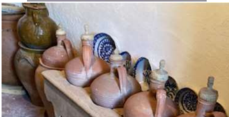
Imagen 7 y 8. Tabla de lavar y cantareras.

A esto se suman los lavaderos presentes en numerosos pueblos del entorno cercano. Junto a este patrimonio material existe un gran patrimonio etnográfico, formado por los utensilios del lavado como: tablas de lavar, cántaros, lebrillos, barreños, etc. Así como los utilizados para poner los cantaros de agua como las cantareras y las aguaderas. A lo que se suman bienes del patrimonio inmaterial como las técnicas y conocimientos relacionados con el lavado de ropa, fases del lavado y el procedimiento para hacer el jabón con el aceite sobrante. En el caso del ir a por agua era necesario conocer que agua era la mejor y tener la destreza para llevar los cántaros. Señalar la importancia del patrimonio emocional vinculado a los lugares donde las mujeres realizaban estas tareas, en los cuales vivieron experiencias que hoy forman parte de su memoria e identidad.