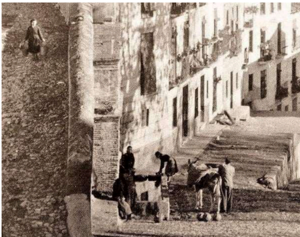
Imagen 6. Mujeres yendo a por agua a un caño con cubos y cántaros