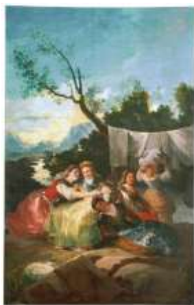
Imagen 10. Las lavanderas de Francisco de Goya.

Los datos cuantitativos se han validado con el programa SPSS en su última versión y los cualitativos con el programa NVivo