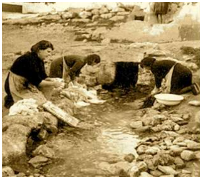
Imagen 3. Mujeres lavando en el río.

Dificultad de acceso al agua para lavar la ropa por la distancia que tenían que recorrer hasta los ríos, ramblas, tejas o acequias donde se lavaba. Por la frecuencia con la que se realizaba, porque las personas disponían de poca ropa, prácticamente una muda y había que lavar una para quitarse la otra. Por ser una actividad que se desarrollaba al aire libre en invierno y verano, fuera del domicilio familiar, con todo lo que ello implica de organización y esfuerzo físico.