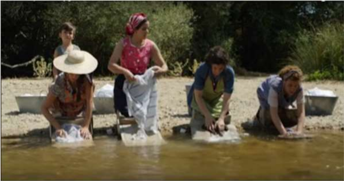
Imagen 11. Fotograma de la película: Honor y Gloria de Pedro Almodovar