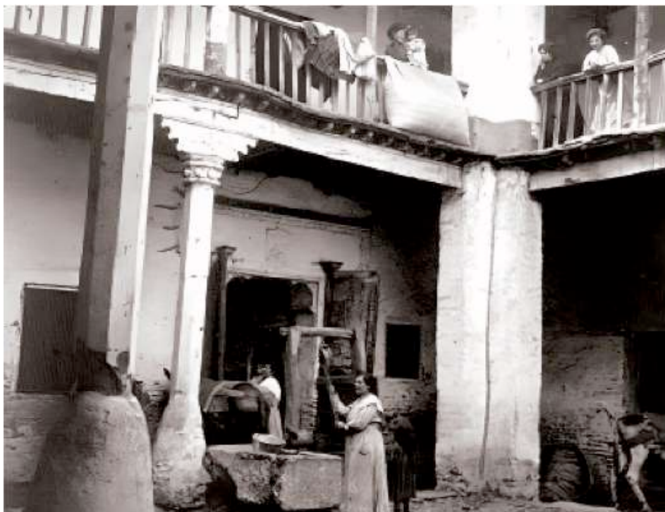
Imagen 2. Mujeres sacando agua del pozo y lavando. Foto: Arturo Cerdá y Rico, ca. 1905

Nuestro proyecto sin dejar de lado este aspecto, se centra en el lavado de ropa y en llevar el agua a las casas para uso doméstico, como una actividad doméstica, pues es necesario realizar investigaciones que tenga como objetivo poner en valor y reconocer la importancia de las actividades de mantenimiento que ocupaban el tiempo de las mujeres, de forma continua en su vida cotidiana, sin remuneración alguna.