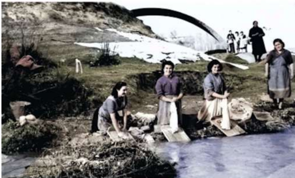
Imagen 5. Mujeres en la río lavando. https://www.galera-granada.es/Fotos-Antiguas/index.htm