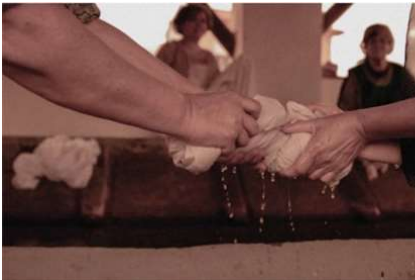
Imagen 9. Mujeres lavando en el lavadero.