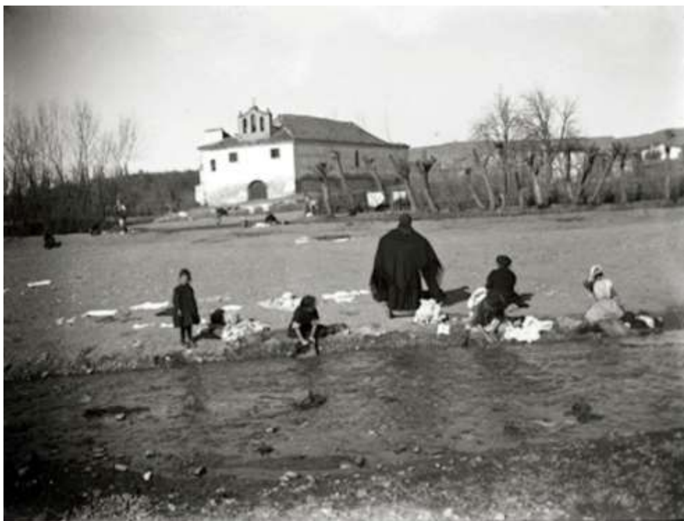
Imagen 4. Mujeres lavando en el río y soleando la ropa. Foto: Arturo Cerdá y Rico, ca. 1905

De hecho, la creación de los lavaderos públicos, en la prensa de la época, se justificaba por la necesidad de mejorar la dureza de las condiciones de las mujeres en el lavado de ropa. Como queda recogido en la prensa de la época. A pesar de la dureza de esta actividad, el lavado de la ropa se llevaba a cabo en grupo y varias mujeres organizaban el día de lavado que pasaban fuera de la casa. En ocasiones, sobre todo en verano, los niños acompañaban a sus madres y pasaban con ellas el día, como si fuera un día de campo. Las mujeres aprovechaban para bañarse en verano y asearse en invierno y mientras lavaban se generaba un espacio de relación social, en el que hablaban de sus cosas y de la vida cotidiana, reían, cantaban y a veces jugaban mientras la ropa se soleaba.