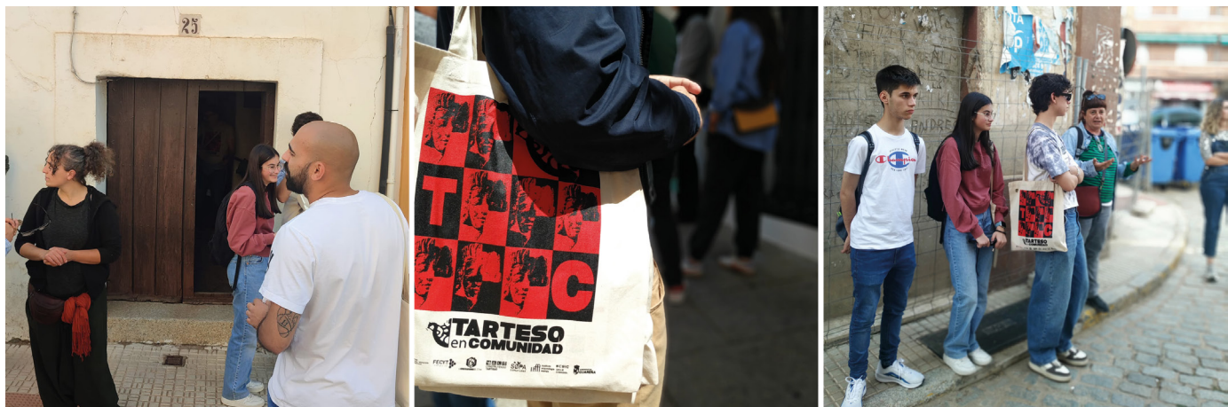
Figura 7. Deriva Patrimonial “Viaje a las Casas con Corazón de Tierra”.

ba en riesgo de desaparecer al estar en venta para derribarla y construir una vivienda nueva. También se visitó el exterior del Teatro Victoria Esperanza, para que el equipo de TARSisSCIENCE presentara los resultados de la acción “Vicky, Esperanza, Guareña”.