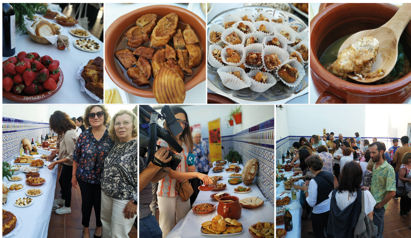
Figura 8. Imágenes de la Merienda-Cena Ritual y algunas de las elaboraciones aportadas.