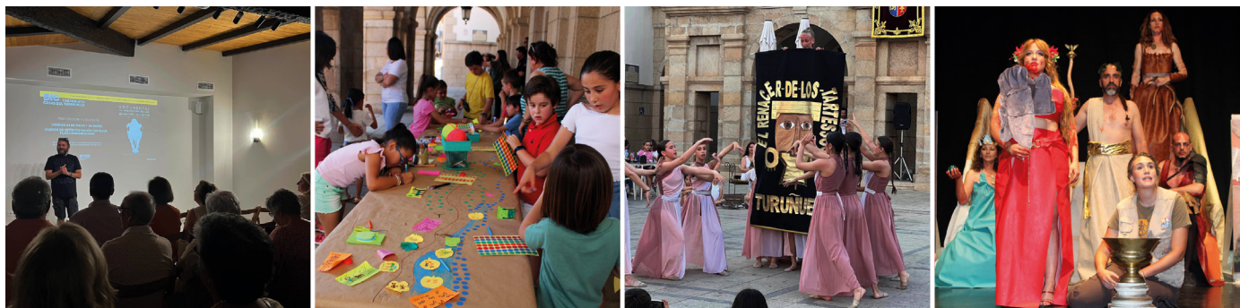
Figura 10. Actividades desarrolladas con motivo de la celebración del tercer aniversario de la declaración del yacimiento de Casas del Turuñuelo como BIC.

En definitiva, con TARSisSCIENCE, desde nuestra voluntad del “ querer aprender/querer enseñar ”, como miembros de una comunidad, consideramos que es necesario establecer una serie de líneas de actuación que engloben todas las necesidades, todas las herramientas, todos los actores y todas las variantes que dificulten o enriquezcan los distintos procesos de aprendizaje o de generación de conocimiento desde múltiples puntos de vista. Y que mejor forma de hacerlo que desde un contexto en el que el conocimiento patrimonial se asimile como algo natural, como algo cotidiano.