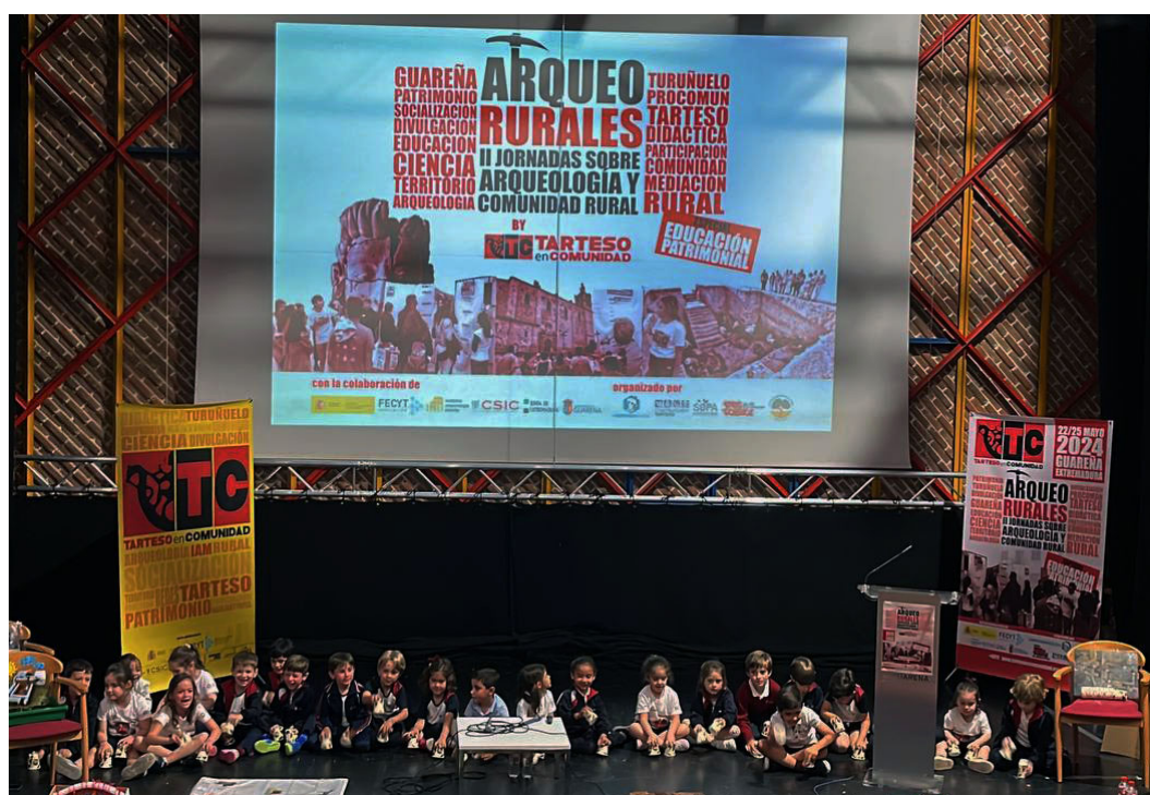
Figura 5. Presentación del proyecto educativo “Cara a cara, miramos a los tartesos”.

En el ARQUEO RURALES de este año, hemos querido poner sobre la mesa cómo se está trabajando desde la gestión y la Educación Patrimonial, tanto desde los discursos tradicionalmente dominantes, como desde la incorporación de nuevos actores, sumando a las comunidades en espacios donde antes no estaban. Es ahí donde entran en juego conceptos como el de Patrimonio Expandido, que nace desde nuestro acercamiento a la Escuela Expandida, convirtiendo la creación de conocimiento patrimonial en un acto colaborativo y compartido que agrega otras formas de gestión educativa para incorporar a diferentes comunidades de aprendizaje y trabajar en torno a procesos de ciencia ciudadana. Así, nos acercamos a la Educación Patrimonial desde lo político y lo crítico, y no como estrategia para captar nuevos públicos, entendiendo la educación como derecho y no como privilegio.