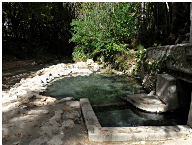
Imagen 4. Pozas de agua caliente de Alhama de Granada

En dicho sentido, el balneario de Alhama de Granada tiene un caudal de agua suficiente, tanto para el balneario como para un segundo uso. En este último caso, el de las pozas termales de uso público, cuya utilidad pública se concedió en el año 1869. Por tanto, la norma permite la posibilidad de entrar, a partir de la Disposición Transitoria Primera, a regular los usos totales que están siendo utilizados por el balneario para que el excedente pudiese ser atribuido a los vecinos en lugar de verse directamente al río. En consecuencia, es por esta vía por la que se podría recuperar parte de los aprovechamientos de las aguas termales. Por todo lo expuesto hasta ahora, entendemos que el aprovechamiento de las aguas termales de Alhama de Granada, corresponde a la empresa privada que las gestiona, mientras que su propiedad es de los vecinos del municipio y del Ayuntamiento, por lo que aquella no puede cortar el suministro del agua a las pozas, puesto que los vecinos tienen derecho a utilizarlas (Imagen 4).