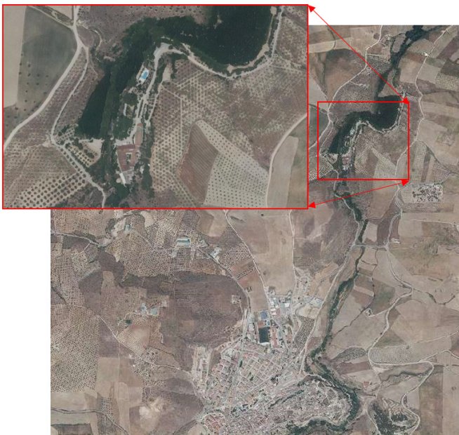
Imagen 1. Ubicación del Balneario en relación al núcleo urbano de Alhama de Granada