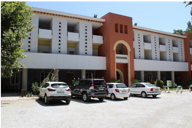
Imagen 2. Edificio principal del Balneario de Alhama de Granada