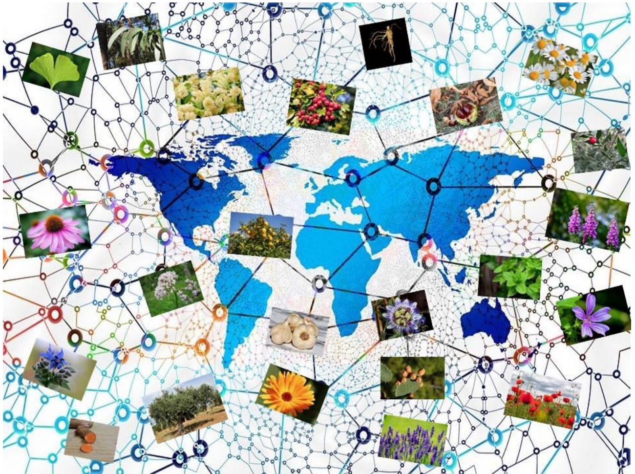
Figura 4. Concepto de herbario virtual online.

Espero que pese a tanta explicación tengáis ganas de realizar el herbario, más por vosotros/as mismos/as que por sumar una nota más de clase, que también es útil, pero no es el objetivo principal.