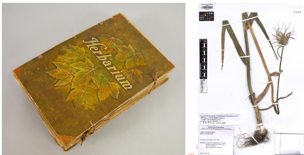
Figura 1. Herbario tradicional y muestra de una ficha o lámina. CCO 1.0

La actividad que se os propone consiste en realizar un herbario . Esto es, una colección de diferentes plantas adecuadamente conservadas e identificadas. En concreto, vuestro herbario va a estar formado por plantas medicinales , las que seáis capaces de encontrar e identificar por vuestros jardines, parques, macetas, ciudad, paseos o excursiones, preferiblemente, las estudiadas durante el curso en la asignatura.