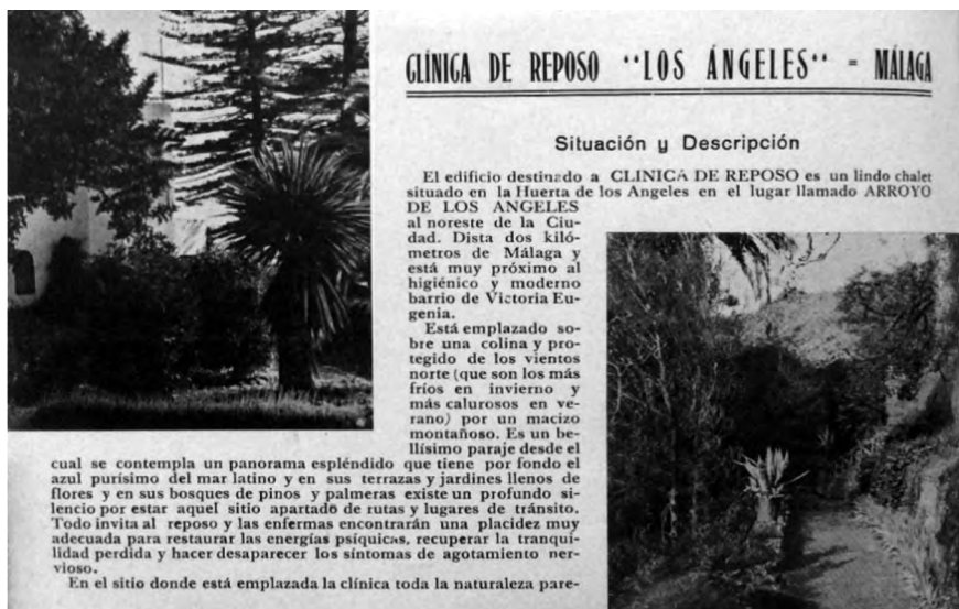
Fig. 2. Fotografías de los alrededores de la Clínica de Reposo.

Todo respira paz y tranquilidad en aquel lugar de ensueño en donde lo que puede conturbar y estremecer al espíritu está rigurosamente eliminado y sólo se perciben sensaciones de bienestar y calma. Conociendo la inmensa fuerza curativa que un ambiente adecuado tiene sobre determinados trastornos del espíritu se comprende perfectamente que las sensaciones de paz se irán infiltrando en las almas delicadas a las que los sufrimientos morales han colocado en trance de enfermedad 58 .