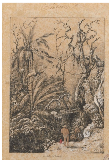
Imagen 3. Henry Price, 1852.

La última de las acuarelas de Price que revisaré en este trabajo es Montaña de Sonsón, Provincia de Córdoba . Esta obra, de entre todas las veinticinco dibujadas por Price, considero que es la más llamativa, a la vez que se desliga del continuum estético del autor (imagen 3).