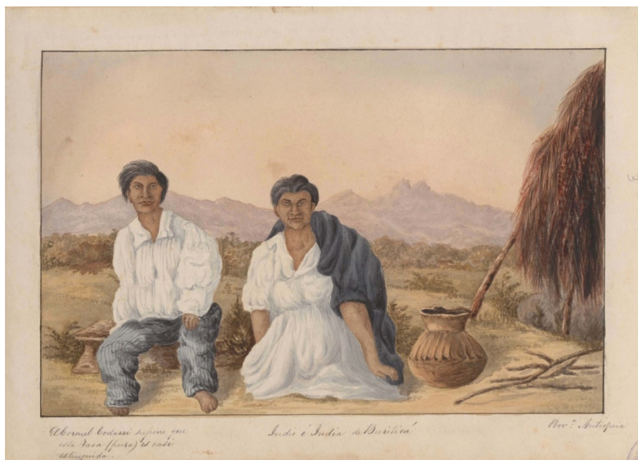
Imagen 1. Henry Price, 1852. Archivo de la Biblioteca Nacional de Colombia.

Los paisajes de Price se caracterizan por una paleta de colores suaves, así como el contraste de las distancias, profundidades y texturas. Appelbaum indica que los modelos de Price exhiben ciertas características que pueden dar prueba de su estatus social. En este caso, hay varios indicadores, uno de los cuales son los pies descalzos del hombre indígena, puesto que llevar los pies desnudos, con alpargatas o zapatos de cuero enuncia la posición sociocultural que distingue el discurso político de la Comisión Corográfica (Appelbaum y Pombo 78). También es distintivo el marco rural en el cual encaja el poco ajuar que se muestra en escena, así como la choza casi entregada a la intemperie. Sus ropas también son tratadas con colores claros que resaltan el efecto de la piel oscura. En esta acuarela, una nota a mano de Price, la cual indica: “El Coronel Codazzi supone que esta raza (pura) es casi extinguida (sic)”. Resulta difícil saber con qué pueblo indígena compartían en ese momento los miembros de la Comisión, sin embargo, persisten sus pómulos distinguidos, la nariz ancha, los ojos alargados, los labios gruesos. Probablemente mayores, Price se preocupó por hacer notar las canas en ambos. El inglés ha dispuesto el escenario para su acuarela al fijar la movilidad de las sombras que le permite la técnica de agua.