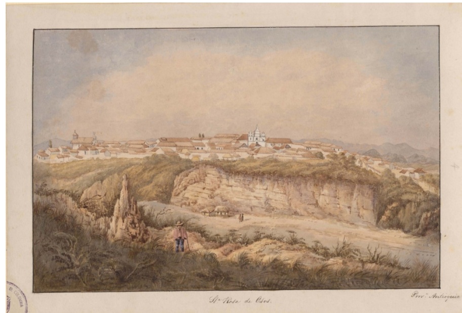
Imagen 2. Henry Price, 1852.

Esta es, sin duda, la fractura entre lo civilizado y lo indómito. El acantilado, custodiado por dos pequeñas casas y dos campesinos, marcan el límite y a la vez la puerta de entrada al ideal de Nación que dominaba sobre la Comisión Corográfica. Las sombras se hacen más latentes en los lugares más alejados del pueblo. La sombra de la rusticidad del campo se muestra desde el lugar de vista del pintor y también del observador.