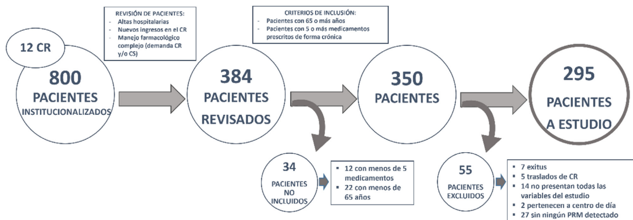
Figura 2 Flujo de pacientes incluidos y excluidos.