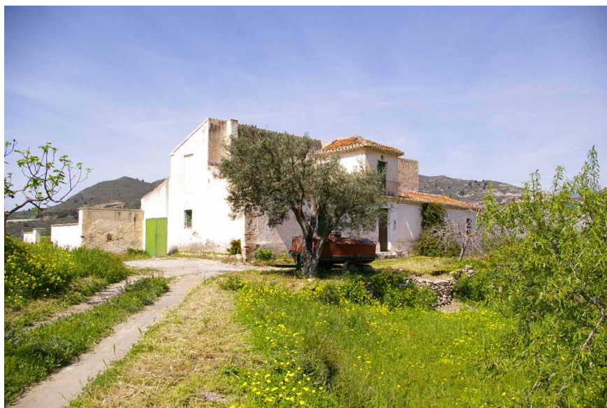
Lámina 11. Cortijada en la zona de la Gorgoracha

De una, a lo sumo dos plantas, la tendencia a acrecentar la estructura se produce por la adhesión de un nuevo módulo que duplicaba las crujías, adosando en otros casos lateralmente un nuevo volumen al módulo central. Se generaban de esta forma estructuras alargadas o con esquemas en L, contando con un solo acceso separado del corral, al que se accedía de forma separada a la vivienda. La presencia de pozos junto a ellos, protegidos por casetas de distinta tipología, explica su localización y el factor determinante del agua para el poblamiento 49 .