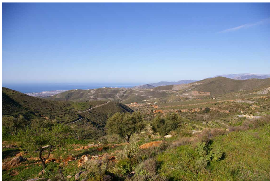
Lámina 1. Vista de la costa desde Lagos

Teniendo en cuenta las notas anteriores, debemos considerar que es la costa granadina en su generalidad, la que permite comprender cual ha sido la dinámica de modelación histórica de la Sierra de Lújar, a partir del conocimiento de la fuerte impronta de los grupos que la han transitado, habitado y explotado sus recursos. Sin su presencia no se puede entender una evolución que con aportes propios y foráneos generaron una intensa dinámica de intercambio 6 .