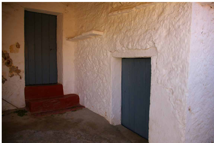
Lámina 9. Portal de vivienda tradicional. Lagos

En esta localidad encontramos un esquema urbano y unas tipologías edilicias que nos permiten entender cuál pudo ser la estructura original con la que se diseñó en el siglo XVIII, inmediata a la población medieval del mismo nombre, de la que nos han llegado suficientes restos como para llevar a cabo un estudio comparativo muy sugerente.