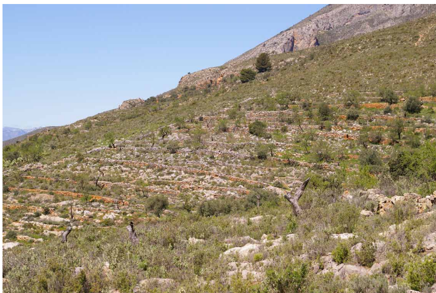
Lámina 5. Pendiente con muros de piedra en la Sierra de Lújar

Esas posibilidades que brinda el territorio para el desarrollo de determinadas actividades económicas explican la ubicación de los puntos de poblamiento, ya que en el caso del municipio de Vélez de Benaudalla registra huellas de presencia humana desde la Antigüedad. Las riquezas de esta zona, con abundancia de agua, tierras cultivables y una minería que, aunque de pequeñas pretensiones, funcionaría como base en el desarrollo de una actividad de intercambio regional y en el inicio de un desarrollo tecnológico que se proyectaría en el tiempo, justificarían su localización.