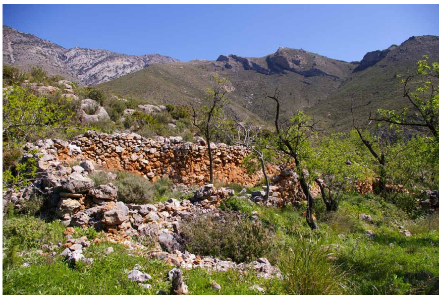
Lámina 12. Aprisco en la Sierra de Lújar

Otros edificios que se reparten por la sierra son, como hemos mencionado anteriormente, los apriscos en los que se guardaba el ganado. Insertos en el paisaje, están formados por un espacio techado de planta rectangular y cubierta a una sola agua, realizada en mampostería y delante de la que se dispone la zona abierta cercada por un murete de piedra donde se reunía al ganado. Destaca en este caso el empleo de una piedra trabajada como lasca y la utilización de la técnica de la piedra seca en una parte importante de la construcción, que consiste en la ausencia de mortero en la trabazón del material. En cuanto a los molinos los ejemplos que nos han llegado están insertos dentro de los núcleos de población o dispersos en el territorio pero con un estado de ruina tal que solo nos permiten testimoniar su presencia.