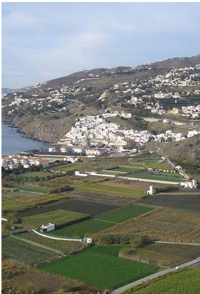
Lámina 2. Vista de la vega de Salobreña

dinamizador social y económico que influenciaría los territorios próximos como es el caso del que analizamos 15 .