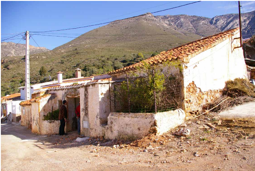
Lámina 8. Arquitectura tradicional. Lagos

En uno u otro caso, se trata de estructuras realizadas con materiales del entorno como piedra, madera, tierra y cal, siendo las técnicas más usuales la mampostería en el primero de ellos, los rollizos o troncos sin devastar en el segundo, el mortero, adobes y los tapiales en el tercero, dejando la referencia de la cal, abundante en la zona, para las mezclas con arena, base de los morteros con los que se asentaba la piedra e integran los revocos.