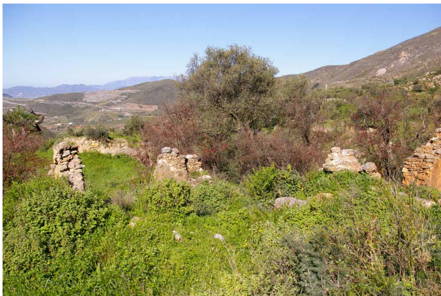
Lámina 7. Vista parcial del antiguo enclave de Lagos

La situación contradictoria que implicó la colonización cristiana del reino de Granada, en la que el avance del cereal y de la ganadería se hizo a expensas de una base social musulmana 36 , no se puede entender sin factores como la venta de señorías, que trastocaron la ordenación del territorio, dando lugar a la conformación de grandes propiedades dentro de un proceso en el que la oligarquía granadina se había convertido en la continuadora de la nobleza nazarí 37 .