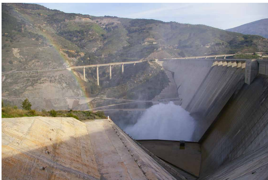
Lámina 3. Presa de Rules

La explotación del territorio diseñada por la política ilustrada del XVIII, es la que consolida el modelo de poblamiento y aprovechamiento de los recursos que nos ha llegado a la actualidad, cuyos testimonios y restos lo muestran básicamente disperso y próximo a puntos de agua que garantizan su permanencia. Una estructura que tiene su contrapartida hoy día en el proceso de renovación en el que se encuentra inmerso el sector agrícola y que lo está alterando. Tanto los cambios que están conociendo las producciones bajo invernaderos, como las expectativas abiertas por la construcción de infraestructuras como la Presa de Rules y la garantía en el abastecimiento de agua para los agricultores de la costa que ello conlleva, son muestra de una presión que está alterando la imagen tradicional de este espacio, y que en cualquier caso está afectando a la pérdida o perpetuación de los hitos referenciales del paisaje de la costa de Granada.