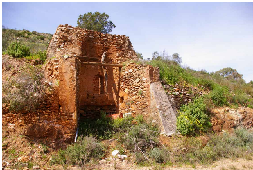
Lámina 4. Restos de las explotaciones mineras de la Sierra de Lújar

No perdiendo de vista esto, los restos del poblamiento en el sector occidental de la Sierra de Lújar que nos han llegado, no hacen más que testimoniar una realidad social que va más allá de la mera existencia de la minería como recurso económico y de subsistencia de esta población 25 .