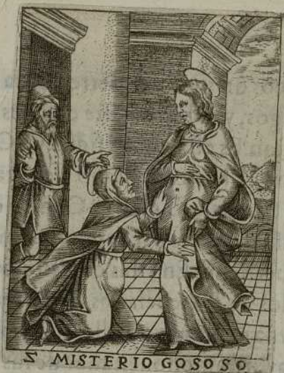
S MISTERIO GOSO SO