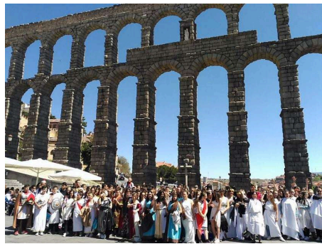
Griegos y romanos en el Día de la Fundación de Roma (Segovia, 22 de abril de 2022)