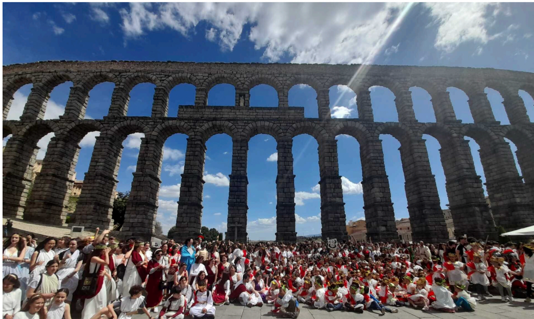
Celebración del Día de la Fundación de Roma junto al Acueducto de Segovia