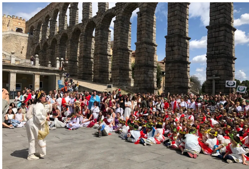
Romanos conmemoran la Fundación de Roma

La Asociación Internacional Alma Clásica organiza la VIII Edición de la conmemoración de la Fundación de Roma