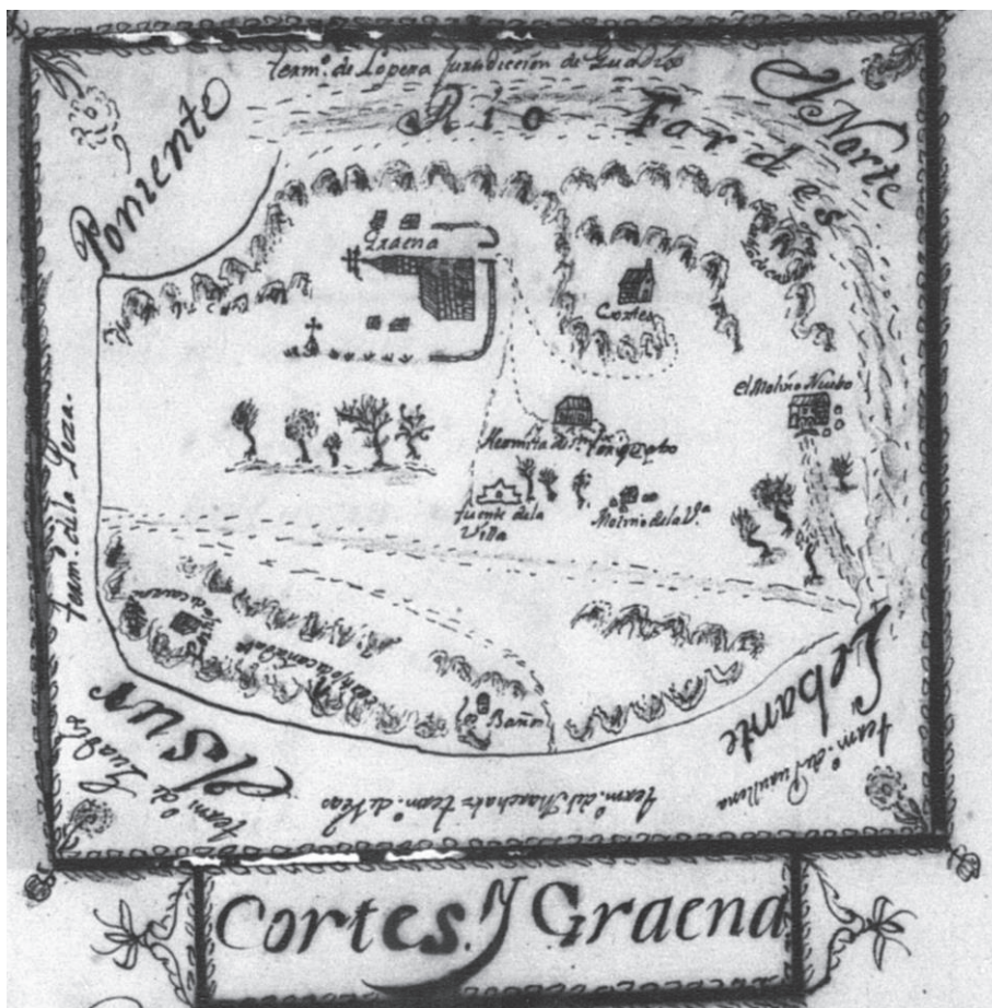
Figura 2. Croquis Cortes y Graena. (1752).

La pregunta decimoséptima nos informa sobre la industria: si hay algunas minas, salinas, molinos harineros o de papel, batanes u otros artefactos en el término, distinguiendo de qué metales y de qué uso, explicando sus dueños y lo que se regula produce cada uno de utilidad al año.