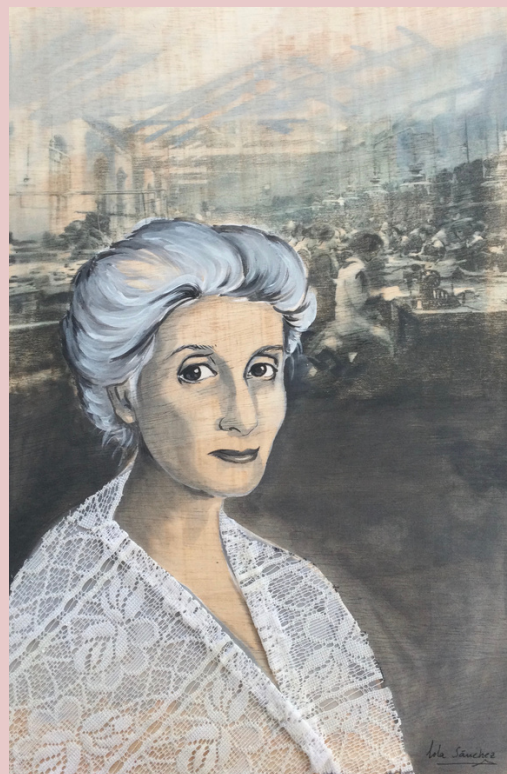
Beatrice Potter Webb