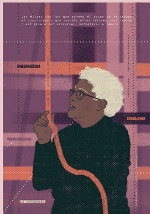
Patricia Hill Collins