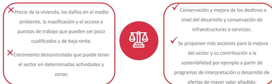
Figura 3. Pros y contras del efecto del desarrollo del turismo para los destinos