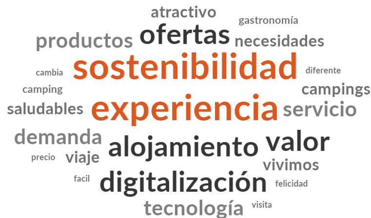
Figura 2. Nube de palabras en torno a la evolución del sector turístico

de palabras (Figura 2) a partir de la que se muestran términos clave en la evolución del sector. Destacan términos como la sostenibilidad, la experiencia, la digitalización, el valor, y el alojamiento, entre otros.