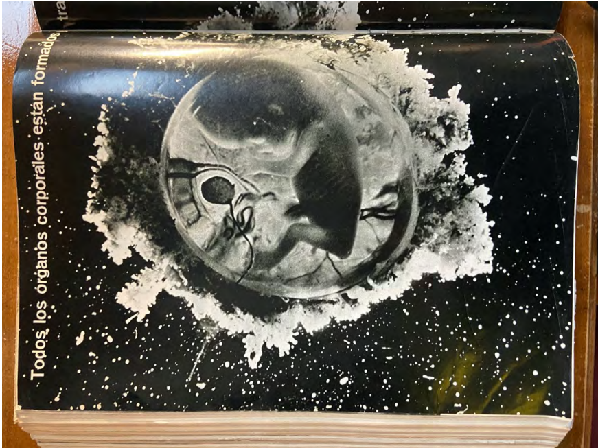
Figura 3: "Todos los órganos corporales están formándose".

Las imágenes de cromosomas en fotografías y dibujos a tinta son contemporáneas de las que el fotógrafo sueco Lennart Nilsson, publicó de embriones