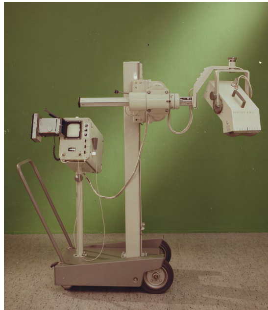
Figura 5. Vista completa del ecógrafo Vidoson. A la derecha el brazo y a la izquierda el pequeño monitor.

Un buen entrenamiento del ojo fue requisito para entender y explicar lo que se presenciaba cuando en 1970 el ecógrafo Vidoson permitió una de las primeras imágenes obtenidas de feto y la placenta por un equipo del Hospital Clínico de Madrid 44 . Lo que pudo calificarse de imprecisas formas en una pantalla demostraba que el uso de tal aparato acarrearba un entrenamiento del ojo clínico, ya al corriente de la lectura de las radiografías. La interacción que se produjo entre las tecnologías en plena expansión de la televisión con las ondas de ultrasonidos. Entre la pantalla y el abdomen, la mediación tecnológica quedó recluida en una caja negra como intermediaria que convertía unas ondas ultrasónicas en películas fetales.