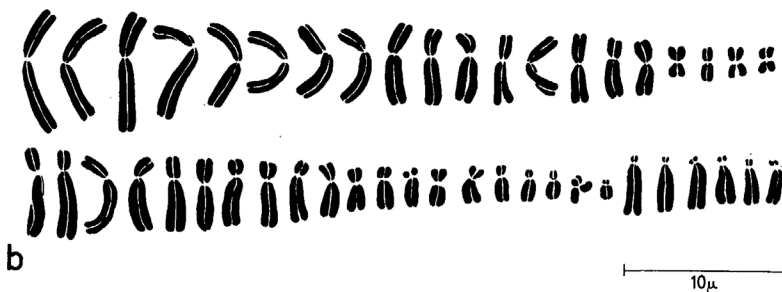
Figura 2: Dibujos a tinta de los cromosomas humanos, ordenados por tamaño. Fuente: Tjio y Levan, "The Chromosome Number of Man", Hereditas 42 (1956): 1-6, p. 4.

Junto a la foto se publicaron los dibujos a tinta china del conjunto de cromosomas que aparecían en ella, ordenados por tamaños, de mayor a menor: lo que se denominó ideograma. El ideograma se construyó con ayuda de la cámara oscura: una pequeña pieza adosada al visor del microscopio que en la oscuridad permitía proyectar sobre un papel cada uno de los cromosomas, lo que permitía trazar sus contornos de forma fiable en esas proyecciones y ordenarlos por tamaños. Esa práctica de crear orden a partir de una fotomicrografía permitió caracterizar a los cromosomas y clasificarlos. Se produjo una representación estándar que circuló desde 1960 27 . Con esa reorganización de las formas que componían la foto, al recogerlas en un dibujo a tinta los cromosomas se hicieron, por volver a Sontag, realidades materiales (1977: 180) depósitos de saberes biomédicos sobre los cuerpos humanos.