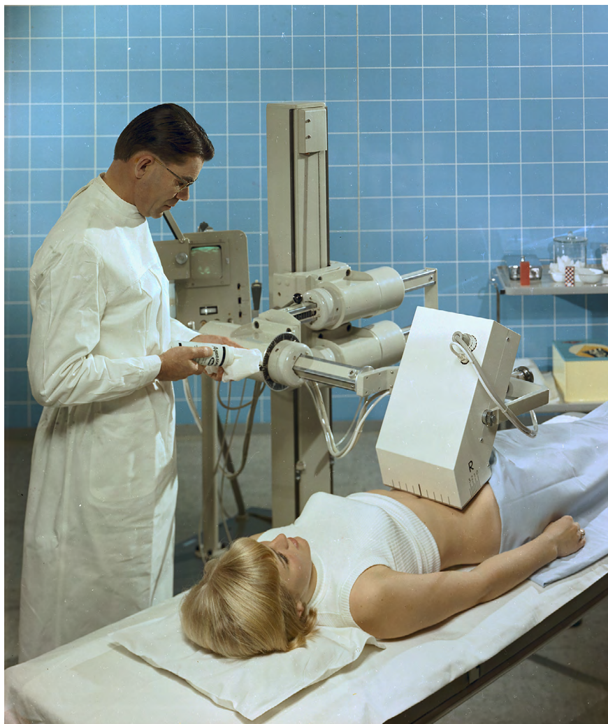
Figura 4. Primer modelo Vidoson de Siemens, en una imagen que fue parte de la estrategia de difusión y promoción del aparato en la clínica europea y de otros continentes.