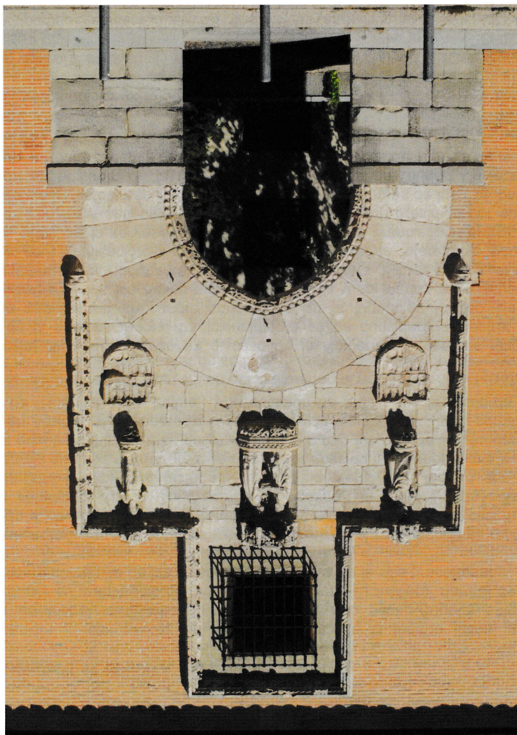
Fig. 1 Fachada del Hospital de la Santa Cruz, o de "La Latina". Escuela Técnica Superior de Arquitectura de Madrid.