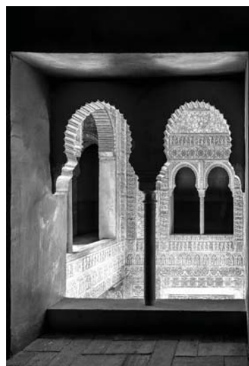
El resplandor. PRIMER PREMIO

Los premios serán entregados en un solemne acto a celebrar en la Sala Máxima del Espacio V Centenario en el mes de mayo de 2023.