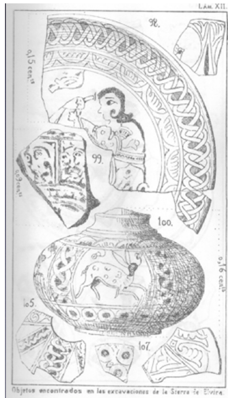
FIG. 5.2. UNA DE LAS LÁMINAS DEL TRABAJO "MEDINA ELVIRA" DE M. GÓMEZ MORENO

como el de Luis Seco de Lucena, dedicado a la topografía histórica de ciudades islámicas, como el caso granadino (1910). En este aspecto concreto asumió especial relevancia la aparición de las primeras instituciones destinadas a la salvaguarda, conservación y restauración del patrimonio español, incluyendo, claro está, el andalusí. Es el período de la constitución de los Museos Arqueológicos y de Bellas Artes, así como el nacimiento de ciertos monumentos señeros como La Alhambra, que dejaba atrás su pasado militar vinculado a la Corona, para convertirse de manera definitiva en Patrimonio del Estado mediante la figura de Monumento Histórico-Artístico (1870).