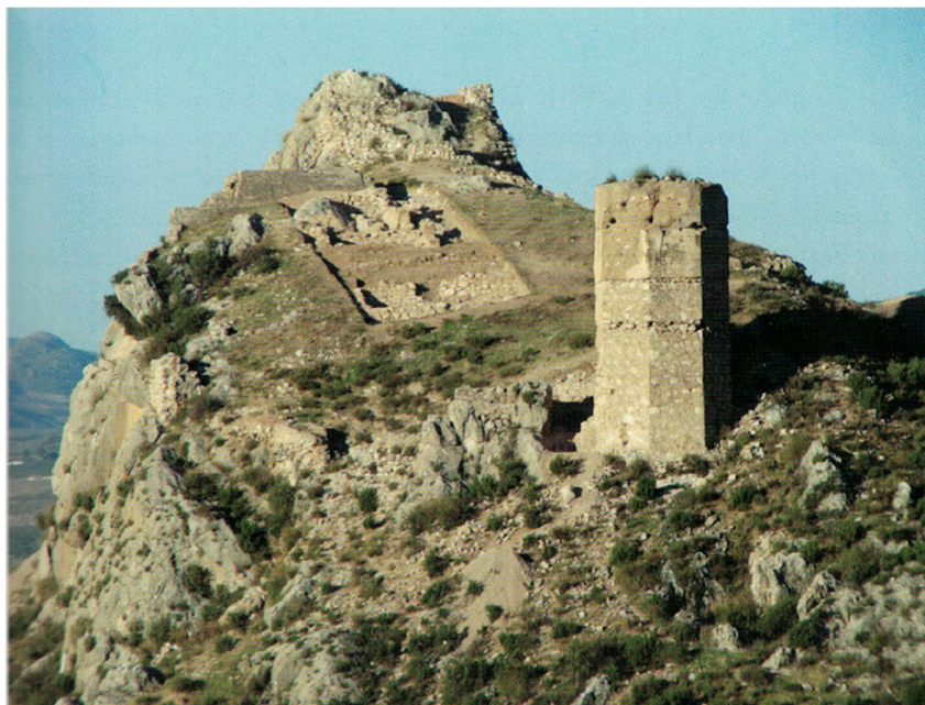
FIG. 5.5. UN CASTILLO RURAL. TIRIEZA (MURCIA)

Este modelo de ocupación del espacio, sufrió importantes transformaciones a lo largo del tiempo. Durante la época almohade parece experimentarse un proceso acentuado de construcción de fortalezas, especialmente en el Levante (AZUAR RUIZ, 1988), aunque podría trasladarse este fenómeno al resto del área andalusí, y de ocupación y puesta en explotación del territorio (fig. 5.5). Y para la etapa final, durante el período nazarí se asiste a la formación de núcleos fortificados de notable complejidad, con la aparición de nuevos elementos y fábricas que denotan la penetración del ámbito urbano en estas estructuras (MALPICA CUELLO, 1996; MALPICA CUELLO, 2008), junto a una presencia más patente del poder nazarí (ACIÉN ALMANSA, 1999).