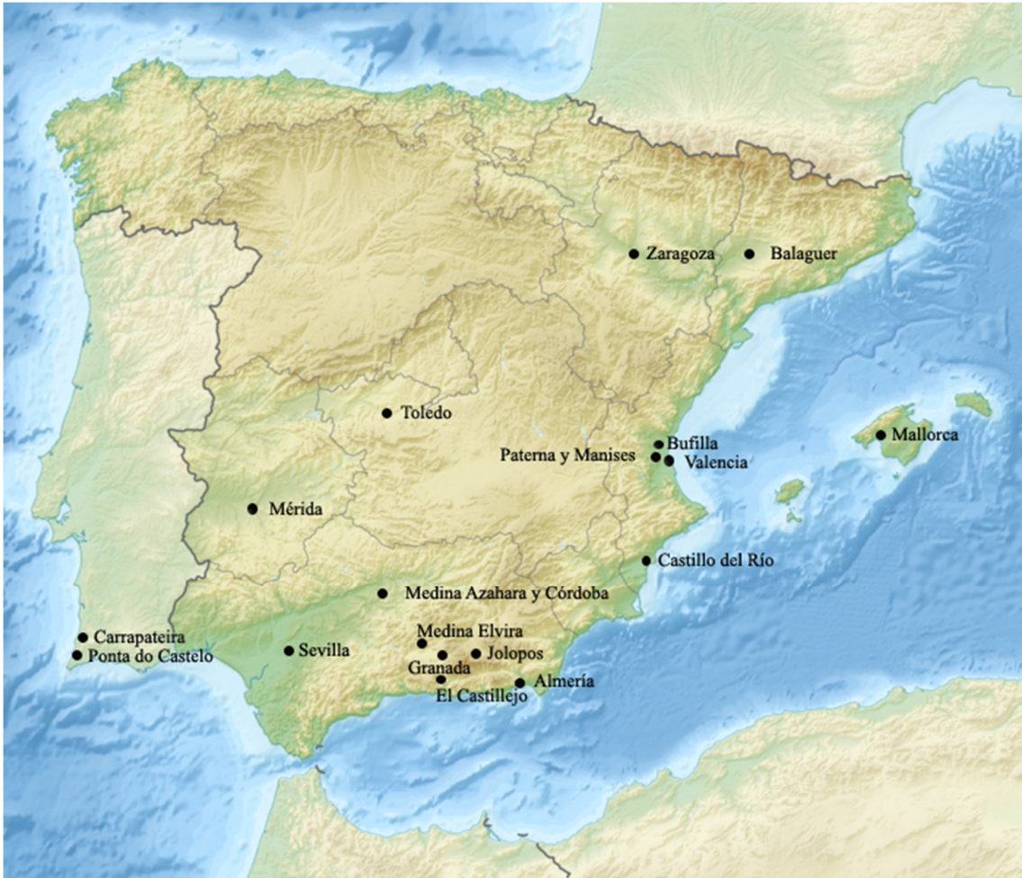
FIG. 5.9. MAPA CON LAS LOCALIDADES CITADAS EN EL TEXTO

Miquel Barceló ya señalaba muy tempranamente, y con gran lucidez, en 1990, los problemas que el desarrollo de la Arqueología de al-Andalus mostraba. Al mismo tiempo intentaba trazar las líneas esenciales de desarrollo de la disciplina, ya que comenzaban a observarse distorsiones en su opinión. Líneas que debían tender hacia una arqueología “que permetés concebre i formular estratègies de recerca arqueològica amb capacitat no tan sols de produir coneixements històrics sino que, el que és més important, establir jerarquies de qualitat entre aquests coneixements” (BARCELÓ, 1990: 244). De este modo M. Barceló reforzaba la estrecha vinculación existente entre la arqueología y la historia, ya planteado desde los años 70 por los investigadores franceses y asumido posteriormente por la nueva generación de historiadores y arqueólogos llamados a consolidar una nueva arqueología de al-Andalus. La arqueología de al-Andalus debía tener como objetivo “entendre l’estructura de la societat andalusina i per proposar explicacions de les pautes identificades que regulen el funcionament dels processos del treball i del moviment y tensions socials que es deriven d’aquest processos. Així, doncs, es tracta d’una arqueologia l’objectiu de la qual és el coneixement històric d’una societat ben concreta...” (BARCELÓ 1990: 243).