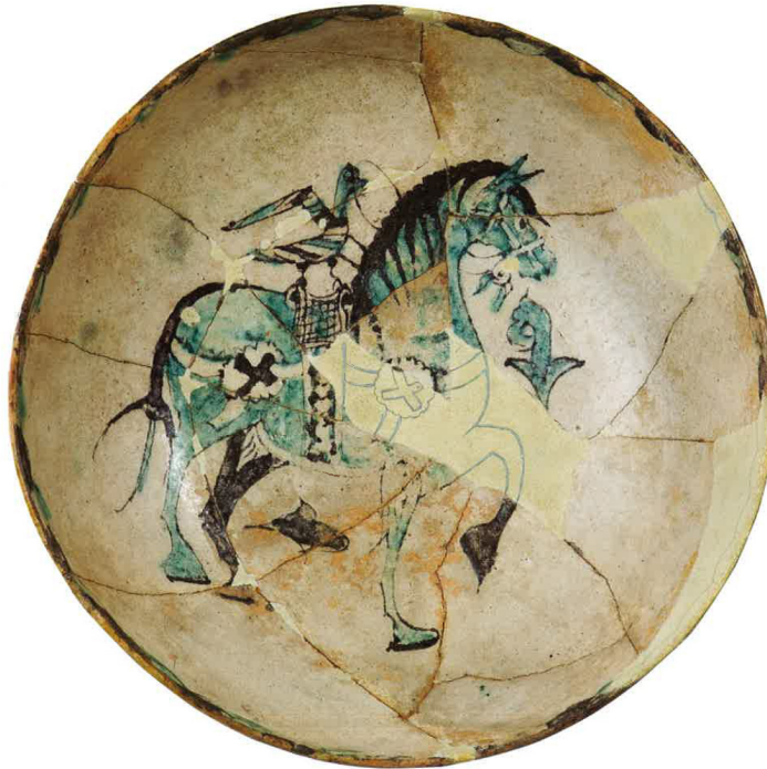
FIG. 5.8. ATAIFOR CALIFAL DEL CABALLO. PIEZA DECORADA CON LA TÉCNICA DEL VERDE Y MORADO RECUPERADA EN LAS EXCAVACIONES DE MEDINA ELVIRA

nombre de cerámica “paleoandalusí”. Se trataba de un conjunto de cerámica tosca, elaborada a mano o a torneta, en muchos casos, y que presentaba rasgos híbridos. Cronológicamente se ubicaba entre los siglos VIII-IX, dentro del período inicial andalusí y fue interpretada por los arqueólogos como una manifestación más de este período transicional emiral. Materiales similares han sido documentados en el Norte de África en este mismo período.