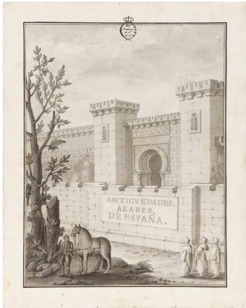
FIG. 5.1. PORTADA DE ANTIGÜEDADES ÁRABES DE ESPAÑA, 1767

Resulta difícil reconocer aquellos trabajos pioneros que se ocuparon de manera específica en el estudio de al-Andalus desde una perspectiva próxima a la arqueología. A mediados del siglo XVIII, tuvo lugar la fundación en Madrid de la Real Academia de san Fernando. Esta institución nació con la intención de estudiar, recuperar y recoger la memoria que se tenía hasta entonces de los objetos y monumentos españoles. Desde la Academia se encargó la redacción de las Antigüedades Árabes de España , cuya primera edición data de 1787 (fig. 5.1), posteriormente ampliada en 1804 (RODRÍGUEZ 2006). Esta obra, surgida del interés cada vez mayor de una burguesía ansiosa por buscar nuevos elementos que sustentaran su supremacía social y cultural, así como por el interés que esta mostraba en atesorar restos del pasado, germen del anticuarismo de la época, se ocupó especialmente de estudiar objetos y restos procedentes de la etapa medieval. El interés por el pasado árabe, por lo oriental, estaba asociado con el surgimiento en Occidente de un nuevo colonialismo. El orientalismo, en este sentido, venía a conformar la imagen del “otro” y, por tanto, contribuía a la definición nacional de las naciones europeas (SAID 1990).