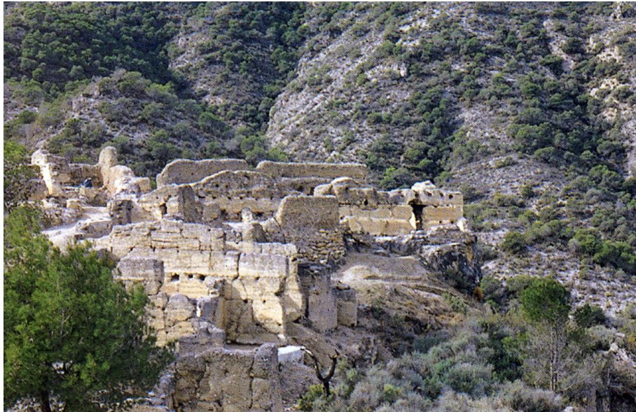
FIG. 5.6. EL CASTILLEJO EN LOS GUÁJARES (GRANADA)

(GUICHARD, 1988). Es éste quizá uno de los aspectos menos conocidos a nivel arqueológico del mundo rural andalusí. Muy pocas han podido ser investigadas arqueológicamente con detenimiento (Jolopos, Castillo del Río, Torre Bufilla, El Castillejo – fig. 5.6 -, Ponta do Castelo – Carrapateira, etc.) y muestran ciertos caracteres diversos (yacimientos abiertos o amurallados, concentrados o disgregados, etc.), aunque presentan una organización urbanística con rasgos comunes: compuestas por varios núcleos, con vías de comunicación intrincadas, que no siguen una organización ortogonal, y en donde los grandes espacios públicos están prácticamente ausentes.