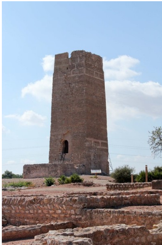
FIG. 5.4. TORRE BUFILLA EN BÉTERA (VALENCIA)

comunidades campesinas en al-Andalus. De esta colaboración surgirán textos fundamentales, como Chateaux ruraux d'al-Andalus , publicado en 1989 con la participación de Patrice Cressier, que por entonces trabajaba en Andalucía oriental, como respuesta a las tesis defendidas por Rafael Azuar (1981) sobre los castillos alicantinos (AZUAR RUIZ, 1981), lo que muestra ya un cierto nivel de debate en el seno de la incipiente arqueología medieval española. También hemos de destacar las respectivas tesis de estado (GUICHARD, 1991 y BAZZANA, 1992) de ambos en donde vierten de manera muy sólida los resultados de sus estudios. Ambos trabajos son esenciales para todo aquel que quiera introducirse en la arqueología de al-Andalus. Han orientado en gran medida los estudios sobre esta disciplina y siguen manteniendo, aún cuando han pasado ya algunos años desde su publicación, un altísimo nivel de validez.