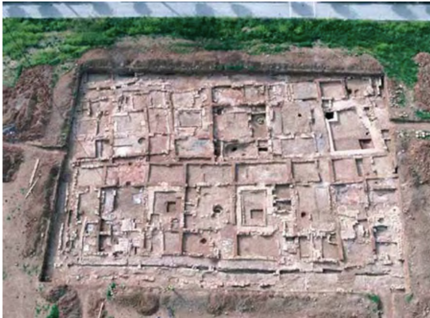
FIG. 5.7. EXCAVACIONES EN LOS ARRABALES DE CÓRDOBA

Las ciudades, en todo caso, no permanecieron inmutables a lo largo de todo el período andalusí. Varios autores han tratado el proceso evolutivo del contexto urbano en los últimos tiempos, presentando un esquema descriptivo y explicativo de sus formas de crecimiento topográfico (NAVARRO, JIMÉNEZ, 2007).